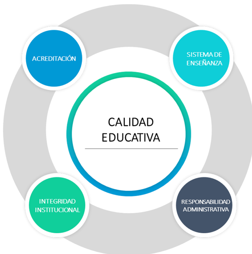
Figura 2. Elementos fundamentales de la calidad educativa