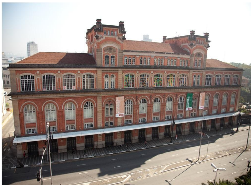
Imagem 3 – Memorial da Resistência

refeitas pelos ex-presos em um ato simbólico. A intervenção museológica foi uma tentativa de minimizar os danos causados pelo apagamento dos rastros traumáticos do passado (Neves, 2014). Atualmente, o Memorial da Resistência de São Paulo conta com um centro de referência para pesquisa, atua na salvaguarda de acervo custodiado, possui auditório, área de exposição permanente, área para exposições temporárias e desempenha ações educativas e culturais com enfoque temático sobre a resistência, controle e repressão política. Porém, além de dividir o espaço com a Pinacoteca do Estado de São Paulo, um museu de arte, ambas as instituições são administradas pela mesma Organização Social da Cultura, o que levanta debates e questionamentos acerca da preservação e fetichização da memória inscrita nesse edifício.