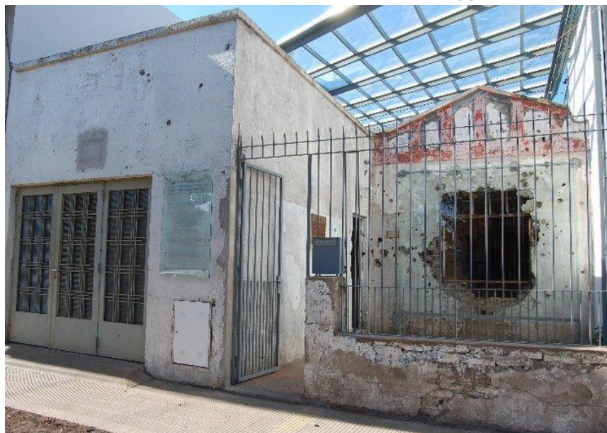
Imagem 2 – Sítio de Memória Casa Mariani-Teruggi