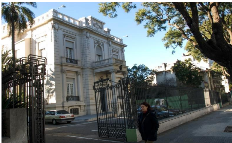
Imagem 9 – Sítio de Memória Ex-SID

permaneceram sequestrados na sede do SID, onde sofreram torturas e, posteriormente, foram desaparecidos. Durante esse período, também foram mantidas em cativeiro pelo menos três crianças, filhos dos presos políticos, uma delas nascida no local. Hoje, o imóvel tombado abriga a instituição nacional de defesa dos direitos humanos e também um museu.