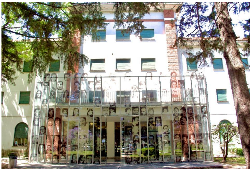
Imagem 1 – Museu Sítio de Memória ESMA

Somente em 2004, sob o governo de Néstor Kirchner, após um longo embate, o complexo da antiga ESMA foi declarado patrimônio nacional. Prevaleceu a intenção de preservar o local por seu valor histórico e simbólico. Os edifícios foram desocupados em novembro de 2007. O Museo Sitio de Memoria ESMA foi inaugurado em 2015, após revitalização, mediante ampla pesquisa, com base em testemunhos de sobreviventes (Neves, 2014).