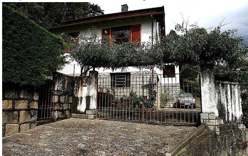
Imagem 5 – Casa da Morte de Petrópolis

O imóvel foi cedido aos agentes da ditadura por um simpatizante do nazismo, emigrado da Alemanha. Com a redemocratização, a casa foi vendida como forma de apagar os vestígios dos crimes que foram ali praticados. Em 2018, atendendo à iniciativa popular e do Ministério Público do Rio de Janeiro, o imóvel foi tombado pela prefeitura de Petrópolis. No entanto, no início de 2020, o Tribunal de Justiça do estado do Rio de Janeiro atendeu ao pedido do atual proprietário e anulou o tombamento municipal, devido a “irregularidades técnicas” (Konchinski, 2020).