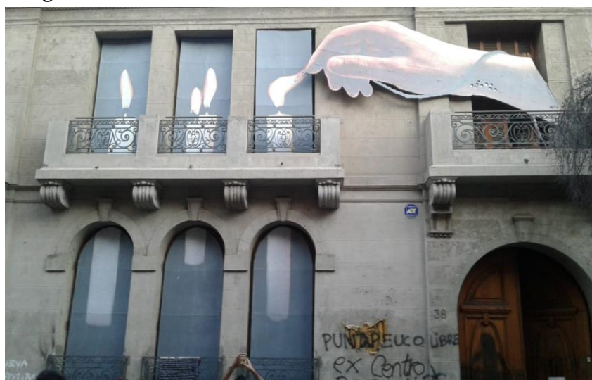
Imagem 6 – Sítio de Memória Londres 38

O sítio de memória Londres 38 está situado na rua Londres nº 40, na zona central da capital Santiago, muito próximo ao palácio presidencial de La Moneda . O nome do lugar de memória, que leva o nº 38, está relacionado à tentativa dos agentes da repressão pinochetista de encobrir as ações clandestinas, alterando a numeração do imóvel. Este foi a sede do Partido Socialista chileno. Entre 1973 e 1975, após ser confiscado pela ditadura, o local funcionou como sede operativa da Dirección de Inteligencia Nacional (DINA), logo após o golpe de Estado (Cabeza Monteiro et al. , 2017).