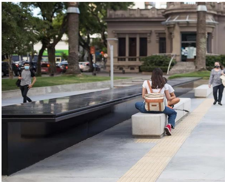
Imagem 8 – Memorial Penal Punta Carretas

O Punta Carretas Shopping, na cidade de Montevideo, é um antigo presídio por onde passaram centenas de presos políticos da ditadura civil-militar uruguaia. Sua fachada foi mantida, mas seu interior foi transformado em um centro de compras. O complexo foi deixado abandonado por anos até que, em 1991, um consórcio privado o adquiriu e transformou as 384 celas em 170 lojas. Essa penitenciária, um dos símbolos do terrorismo de Estado uruguaio, foi convertida em um lugar de esquecimento e consumismo, um lugar de amnésia (Allier-Montaño, 2008). Contudo, em 2021 foi inaugurado o Memorial Penal Punta Carretas, com o nome das pessoas que foram ali detidas, situado na praça pública em frente ao centro de compras.