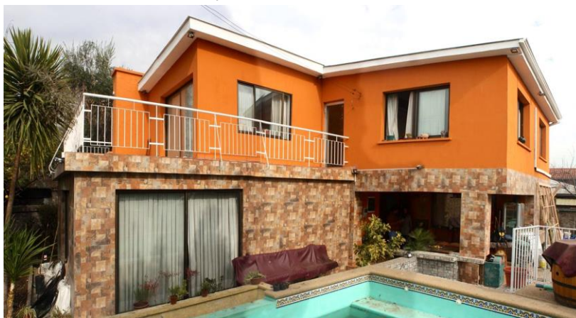
Imagem 7 – Venda Sexy