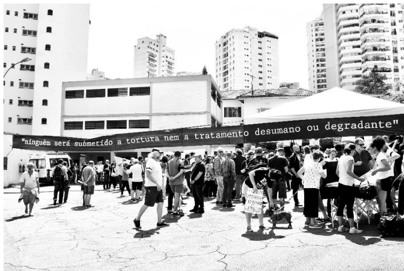
Imagem 4 – DOI-CODI de São Paulo