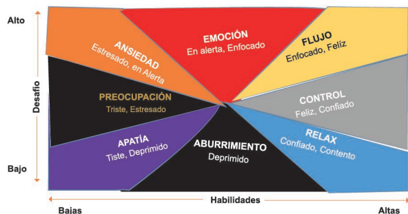
Figura 1 Adaptación gráfica de la teoría de Mihaly Csikszentmihalyi

Esta teoría del flujo en la práctica didáctica contribuye a mejorar y aumentar la efectividad en términos de producción cuantitativa. Ver figura 1.