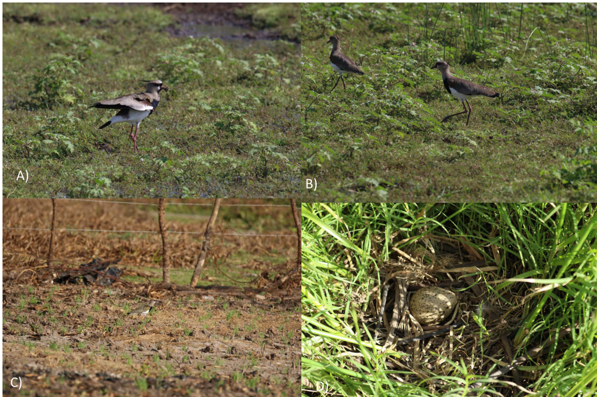
Figuras 2. A) Individuo de Vanellus chilensis en despliegue de alas, El Jocotal, B) Pareja de V. chilensis . El Jocotal, C) Individuo de V. chilensis en los alrededores de la laguna de Metapán, D) Nido de V. chilensis entre la vegetación de Cynodon dactylon y Cyperus articulatus . Poza Los Conacastes, Laguna El Jocotal.

En el Complejo Güija, el 4 de febrero de 2019, a las 16:23 h, en un recorrido de 2 km por los alrededores de la laguna de Metapán (14°18'35.1" N y 89°28'13.8" O) durante 2 h y 30 min observamos una pareja de V. chilensis , presentes en un área de pastizal inundable a 20 m de la orilla del extremo noreste del humedal, interactuando con la monjita americana ( Himantopus mexicanus ), la jacana nortea ( Jacana spinosa ) y el playero diminuto ( Calidris minutilla ) (SalvaNATURA 2019).