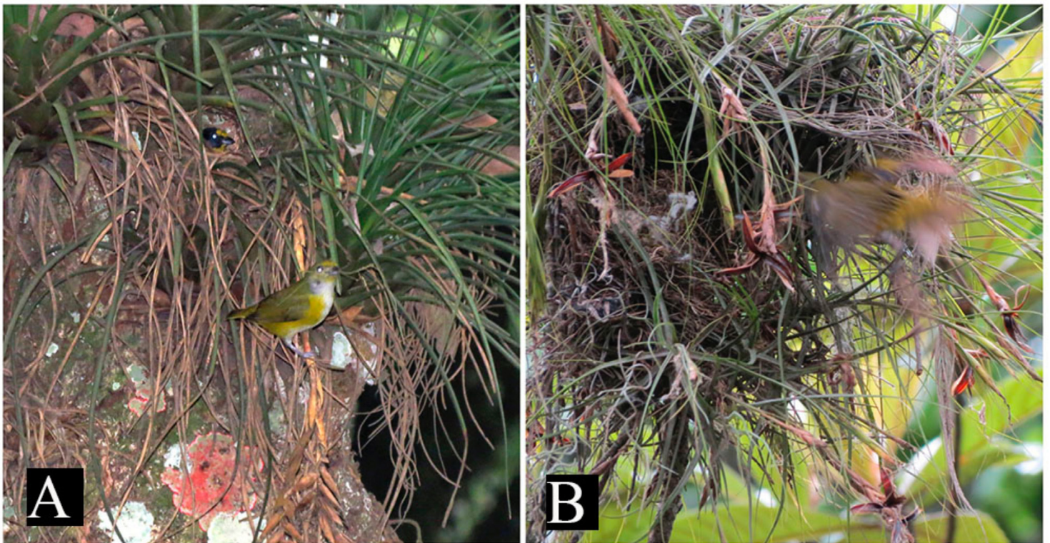
Figura 3. Nidos en bromelias de Euphonia hirundinacea en la región de las Altas Montañas, Veracruz, México. A: Pareja construyendo un nido en Tillandsia tricolor el 28 de abril de 2013 en el camino al Corazón de Metlac, Ixtaczoquitlán, Veracruz; B: Nido en construcción de E. hirundinacea dentro de una aglomeración de T. usneoides y T. schiedeana en la Facultad de Ciencias Biológicas y Agropecuarias de la Universidad Veracruzana, Amatlán de los Reyes, Veracruz el 7 de junio de 2013, observamos a la hembra llevar hojas de Casuarina equisetifolia y otro material vegetal no identificado.

De acuerdo con los registros que presentamos, en la región de las Altas Montañas de Veracruz, la eufonia garganta ama-