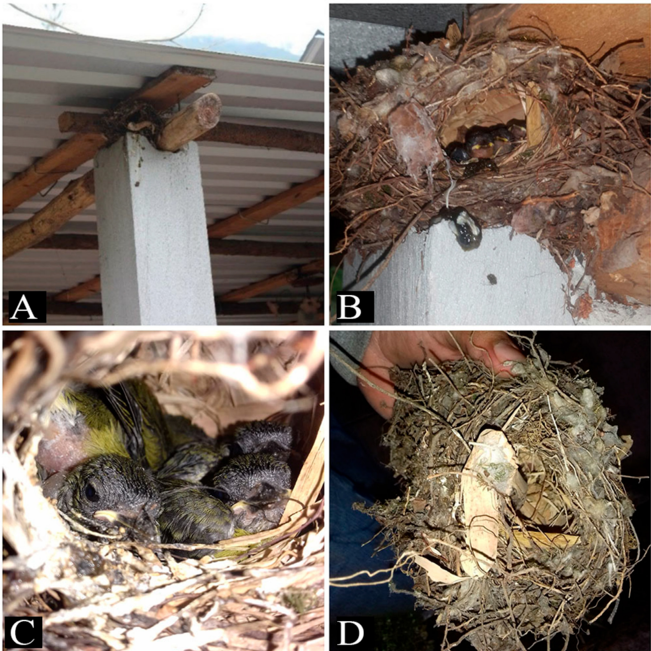
Figura 4. Nido de Euphonia hirundinacea en un sustrato artificial en La Cuesta, Camerino Z. Mendoza, Veracruz, México. A: Vista de la ubicación del nido sobre la columna de una cabaña; B: polluelos sin emplumar, con los ojos ligeramente abiertos observados el 18 de junio de 2017; C: polluelos parcialmente emplumados observados el 25 de junio, son visibles las plumas remeras ya emergidas de la vaina; D: vista al interior del nido, pueden observarse algunos de los materiales que lo conformaban como hojas, ramas, briofitas y fibras vegetales (fotos: A.I. Contreras Calvario).

Cuatro de los cinco nidos que observamos fueron contruidos sobre árboles a una altura de ~ 2.5-8 m, la cual se encuentra dentro del intervalo reportado de 1-15 m (Sutton et al. 1950, Skutch 1954). En estos cuatro casos, las parejas hicieron uso de bromelias: tres de ellas anidaron entre las hojas de estas plantas y en dos casos las incluyeron entre los materiales