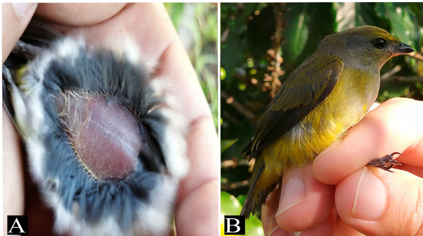
Figura 2. Evidencia reproductiva de Euphonia hirundinacea por características morfológicas, estación MoSI SAPI, Zentla, Veracruz, México. A: Parche de incubación en una de las hembras capturadas el 20 de junio de 2020; B: Joven con comisuras visibles, plumaje fresco con todas las rectrices en crecimiento y aspecto puntiagudo e iris café opaco que indican un individuo de pocas semanas de edad, capturado el 20 de junio de 2020.

El 31 de marzo de 2017, Vásquez-Cruz (com. pers.) observó a una pareja construyendo un nido sobre un árbol de jinicuil ( Inga edulis ) en la FCBA (véase descripción de esta localidad arriba). El macho acarreada hojas de Tillandsia sp. y la hembra llevaba fragmentos pequeños de briofitas. Este nido se encontraba en la unión de una rama con el tronco, a ~ 2.5 m del suelo, mientras que el árbol tenía ~ 8 m de altura; la ubicación interior del nido respecto al árbol lo hacía poco visible de manera frontal o desde arriba, al quedar oculto por el follaje.