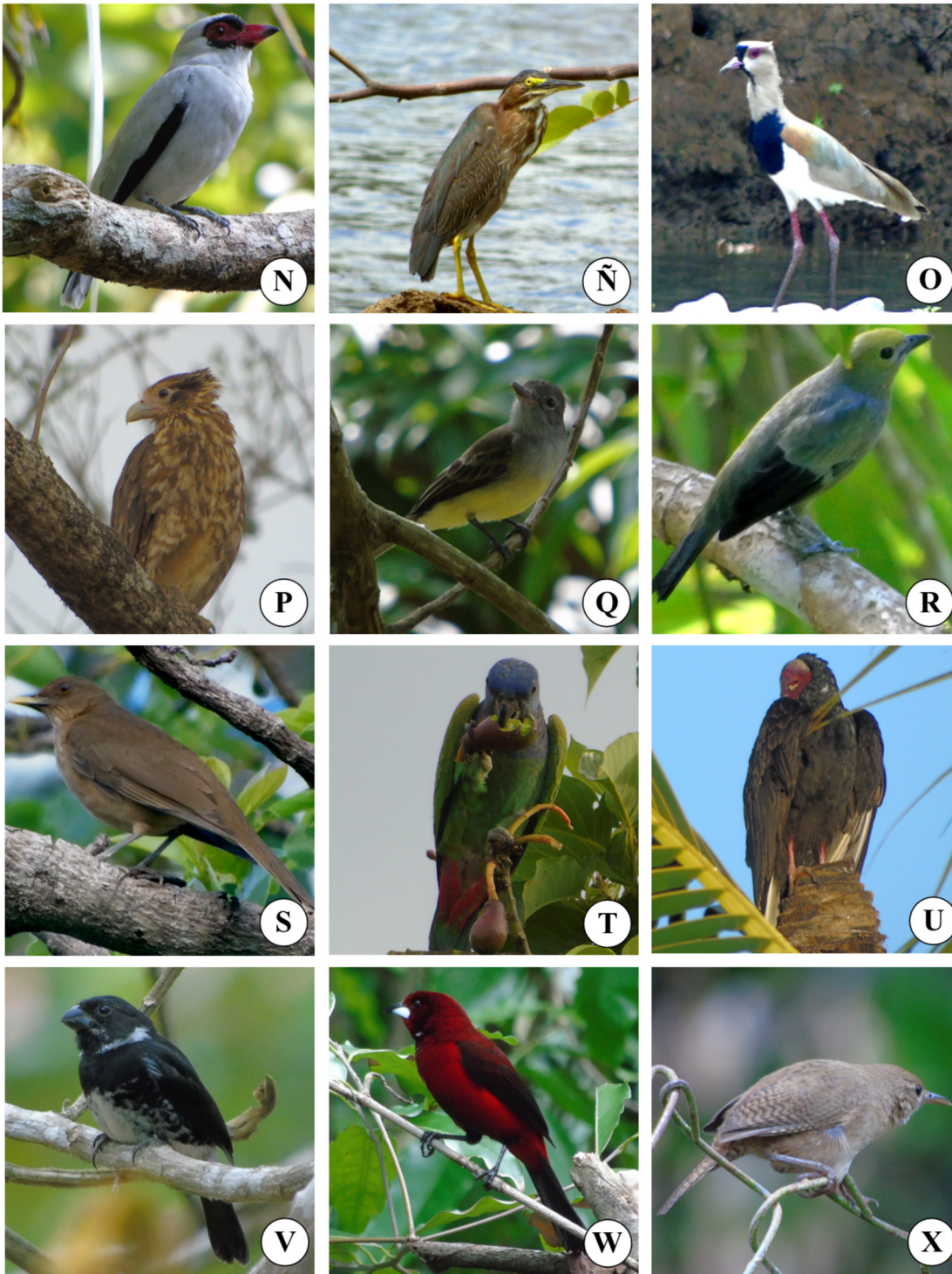
Figura 4. Especies localizadas en poste de observación: N) Tityra semifasciata , Ñ) Butorides virescens , O) Vanellus chilensis , P) Milvago chimachima (immaduro), Q) Myiarchus panamensis , R) Tangara palmarum , S) Turdus grayi , T) Pionus menstruus , U) Cathartes aura , V) Sporophila americana , W) Ramphocelus dimidiatus , X) Troglodytes aedon .

conservación, por ejemplo, El sendero Los Quetzales ubicado dentro del Parque Nacional Volcán Barú. Es una zona de estudio que alberga cinco especies endémicas entre Panamá-Costa Rica ( Actitis macularia , Amazilia edward , Chlorostilbon assimilis , Pteroglossus frantzii y Ramphocelus costaricensis ), algunas son consideradas especies generalistas y otras de hábitos más especialistas. Esta base podrá impulsar nuevos estudios