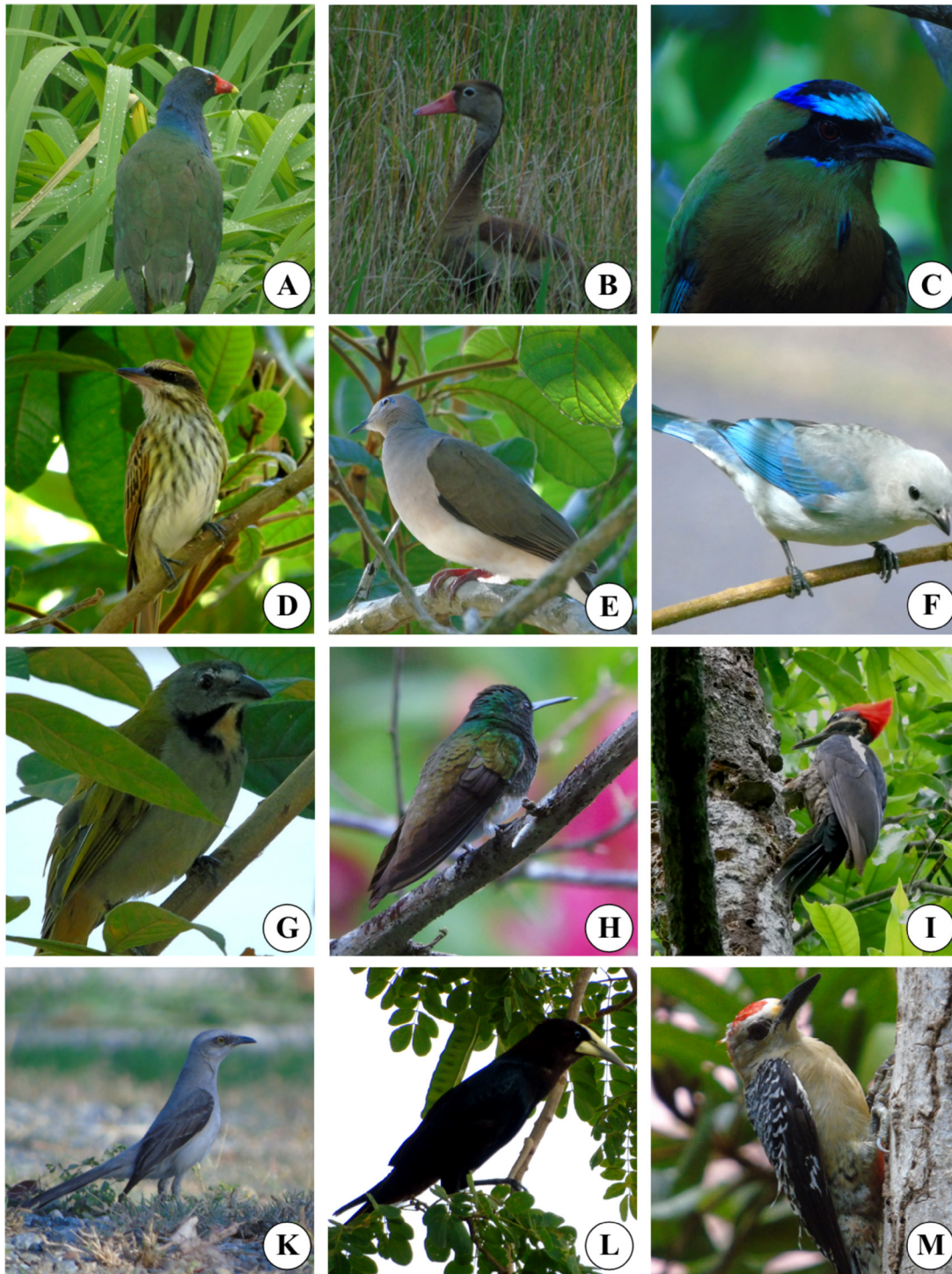
Figura 3. Especies localizadas en poste de observación: A) Porphyrio martinicus , B) Dendrocygna autumnalis , C) Momotus lessouinii , D) Myiodynastes maculatus , E) Leptotila verreauxi , F) Tangara episcopus , G) Saltator maximus , H) Amazilia edward , I) Hylatomus lineatus (hembra), J) Mimus gilvus , K) Psarocolius decumanus , L) Melanerpes rubricapillus (macho).

amenaza es la cacería furtiva, que afecta principalmente a la cría y causa un declive y baja viabilidad poblacional (Castillo y Eberhard 2006). Algunas especies se encuentran como vulnerables, y son capturadas para venderlas como mascotas: Pteroglossus frantzii , Brotogeris jugularis , Amazona autumnalis , Amazona ochrocephala , Pionus menstruus (Gómez-Álvarez et al. 2005). En Rincón Largo remueven de los nidos crías