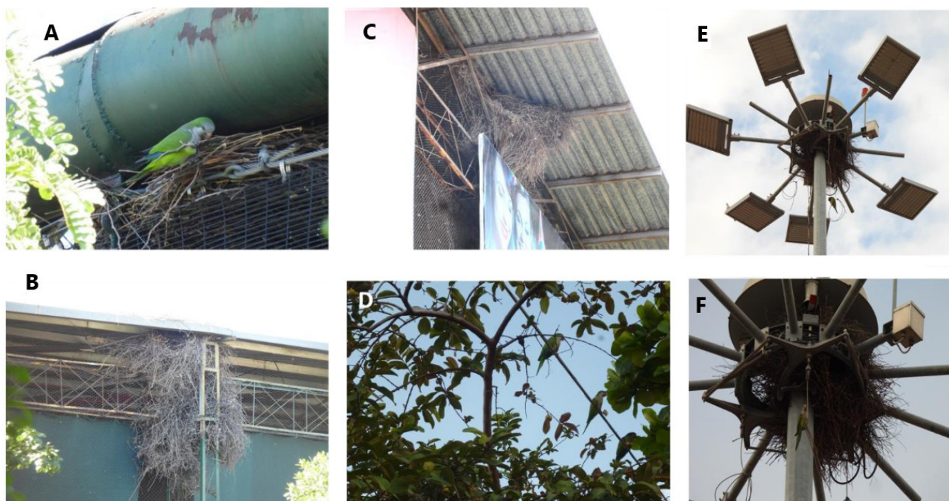
Figura 2. Avistamientos de la cotorra argentina ( Myiopsitta monachus ) en la ciudad de Culiacán, Sinaloa. A cotorra construyendo nido en la jaula del zoológico, B conjunto de nidos en infraestructura del Club campestre y C cotorra en nido, D cotorra argentina alimentándose de fruta Guayaba ( Psidium guajava ), E y F nido de cotorra en poste con lámparas de iluminación.

la jaula y el otro en el soporte del techo de un almacén del Club Campestre de la zona residencial Chapultepec (Figuras 2A, B y C). La distancia entre los nidos fue de 250 m aproximadamente, lo cual confirma la capacidad de esta especie para formar colonias y el uso de la infraestructura urbana como soporte de sus nidos (Romero-Figueroa et al. 2017). El establecimiento de nidos cercanos parece ser una estrategia de la cotorra argentina que le permite avanzar con éxito en su dispersión en la zona urbana (Pablo- López 2009).