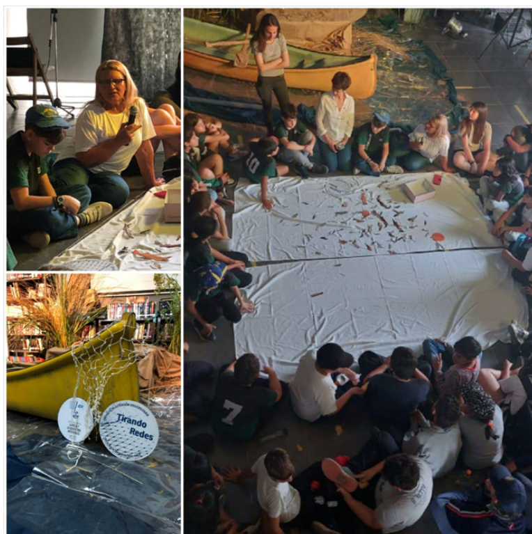
Figura 6: Taller con niños y adolescentes (Pueblo Belgrano, Gualeguaychú)

En la imagen que sigue (Figura 6) se observa a la mujer pescadora en el cuadrante superior de las imágenes (remera blanca y micrófono en mano) quién condujo la actividad de mapeo con niños y adolescentes en la Biblioteca Popular de Pueblo Belgrano.