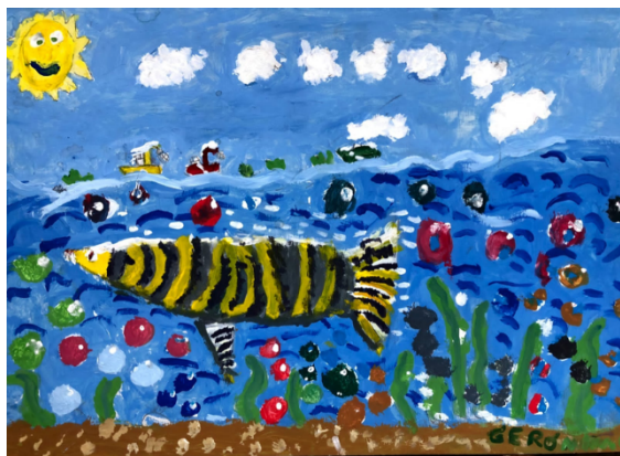
Figura 2: Obras del taller de niños en Villa Paranacito

El movimiento abstracto del agua representado con una técnica mixta, mezclado con los peces y la vegetación, parecen jugar con la luz y el vaivén del agua, así también como con un rico juego de colores de fríos y cálidos