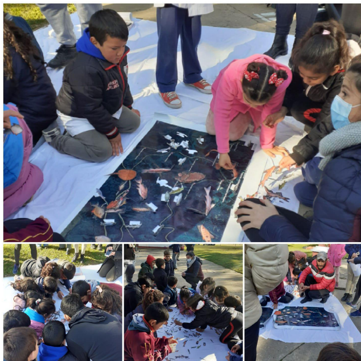
Figura 5: Taller en Escuela N° 4 (Villa Paranacito)

Dentro de esta dimensión, exponemos un conjunto de imágenes que muestran la realización de los mapeos participativos, en la escuela N°4 de Villa Paranacito, en la que participaron niñas/os, docentes y un pescador de las islas. En conjunto, identificaron especies de peces y aquellos sitios dónde se los pescan. Posteriormente, exhibimos algunas imágenes (Figura 5) de uno de los últimos talleres del proyecto en Pueblo Belgrano (Gualeguaychú) en donde una mujer pescadora dialogo con niños y adolescentes intercambiando saberes sobre las especies de peces del río y relatando su trayectoria de vida.