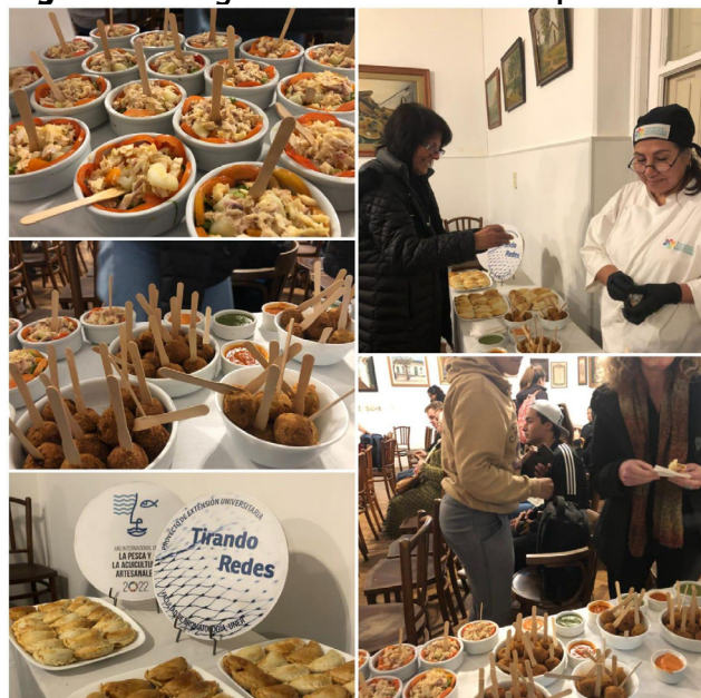
Figura 4: Imágenes del taller "Tiempos de Sabores"

Dentro de esta dimensión técnica, queremos ilustrar algunas de las recetas que se elaboraron por parte de la cooperativa de trabajadores gastronómicos "Tiempos de Sabores", cuyos platos fueron degustados en las actividades ofrecidas por parte del proyecto.