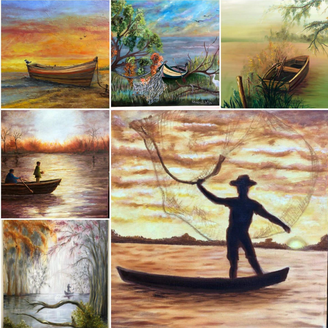
Figura 1: El momento de la pesca en una atmosfera envuelta de vegetación y agua.

Fuente: Cuadros pintados al óleo en el taller de arte de Gladys Zagert, Gualeguaychú (2022).