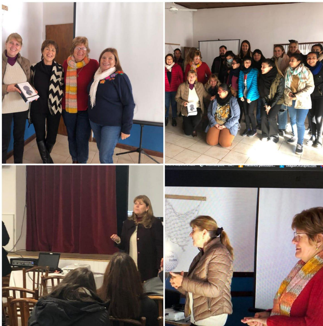
Figura 3: Docentes y estudiantes participantes del proyecto y las dos autoras del libro Villa Paranacito y sus islas cuentan su pasado

participantes del proyecto y las dos autoras del libro Villa Paranacito y sus islas cuentan su pasado.