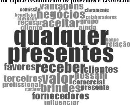
Figura 8 – Nuvem de palavras do tópico recebimento de presentes e favorecimento

presentes e outros favorecimentos passíveis de questionamento do ponto de vista moral” (AZEVEDO 2010, p.68). Essa premissa pode ser identificada na Figura 8 a seguir.