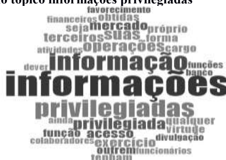
Figura 4 – Nuvem de palavras do tópico informações privilegiadas

O PAN determina que “É considerado crime negociar ou divulgar informações relevantes ainda não disponibilizadas ao mercado (i) para proveito próprio ou de terceiros; e (ii) cuja divulgação provavelmente influenciaria nas decisões de investimento e o preço dos títulos e valores mobiliários”. Em seu código, o IBGC esclarece que “o Código de Conduta deve enquadrar como violação [...] o uso de informações privilegiadas para benefício próprio ou de terceiros” (IBGC, 2009, p.68). A Figura 4 a seguir apresenta as palavras mais frequentes nos códigos das organizações.