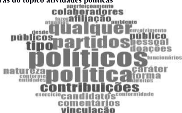
Figura 9 – Nuvem de palavras do tópico atividades políticas