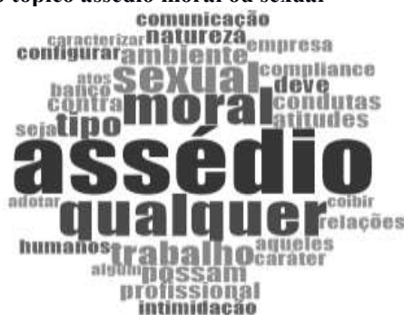
Figura 12 – Nuvem de palavras do tópico assédio moral ou sexual

O Banco do Brasil dispõe que “Repudiamos condutas que possam caracterizar assédio de qualquer natureza”. Nesse sentido, destaca-se que há a perspectiva da coibição e punição caso seja identificado algum comportamento nesse sentido. A seguir apresenta-se na Figura 12 com as palavras mais frequentes em relação ao tópico de assédio moral ou sexual, destacando que é considerado nesse tópico qualquer procedimento que possa configurar assédio.