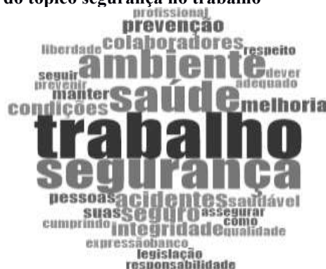
Figura 13 – Nuvem de palavras do tópico segurança no trabalho

Já o banco do Nordeste, determina que “está comprometido com a melhoria das condições de saúde, segurança e higiene, de modo a favorecer o equilíbrio harmônico no ambiente de trabalho”. De acordo com a Consolidação das Leis do Trabalho (CLT) em seu artigo 154: “Cabe às empresas: I - cumprir e fazer cumprir as normas de segurança e medicina do trabalho[...]” (BRASIL, 1977). A Figura 13 destaca as palavras mais frequentes nesse tópico.