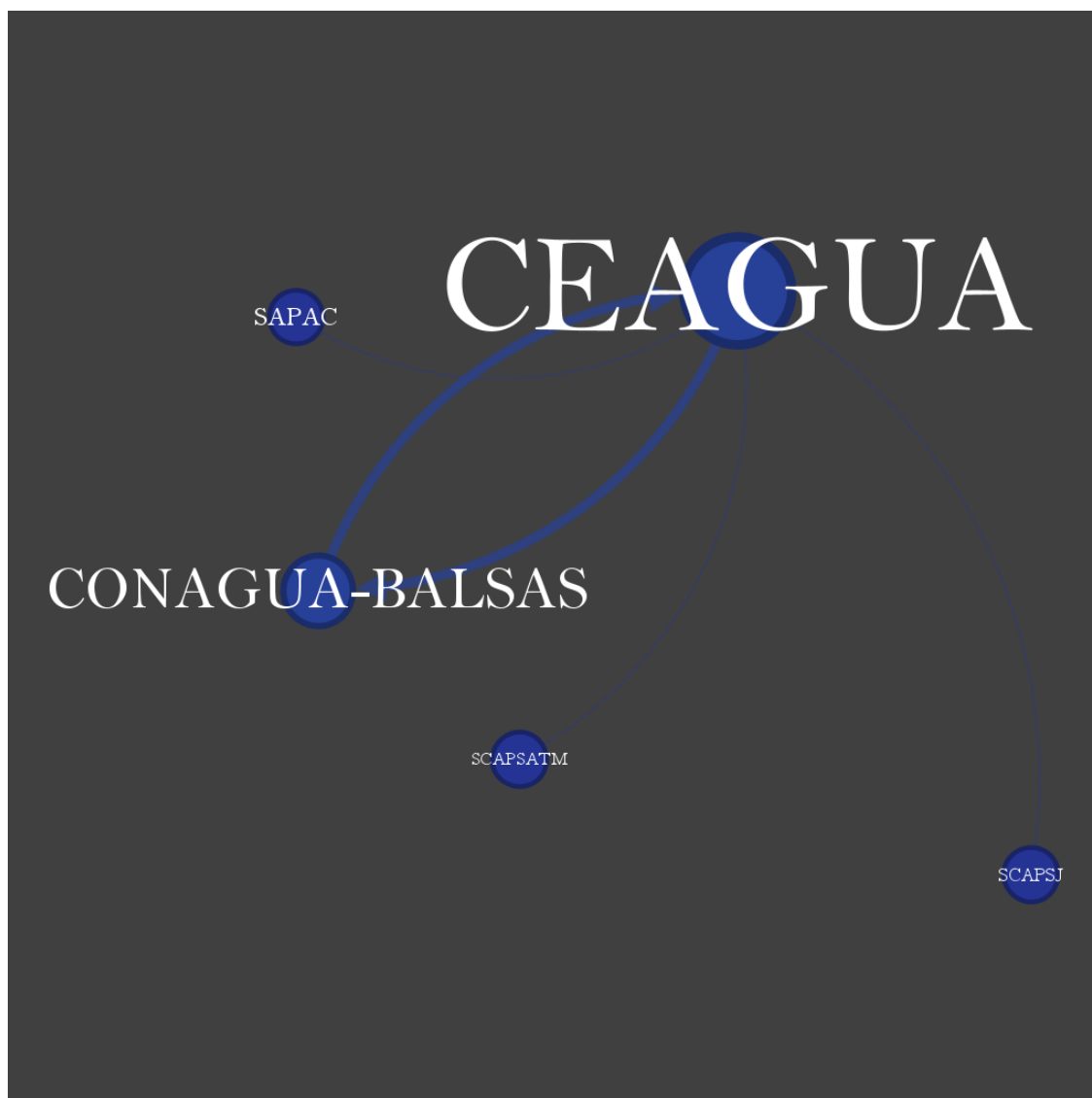
Figura 2. GRAFO ACTORES TEMA AGUA EN EL SBNPM