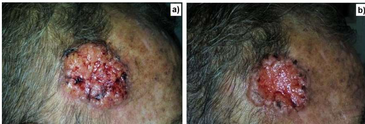
Figura 1. Lesión tumoral localizada en el cuero cabelludo.