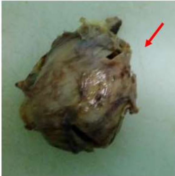
Figura 2. Ganglio linfático resecado. (Flecha).

El colectivo de cirujanos tratantes decidió proceder a la intervención quirúrgica. Se optó por anestesia general orotraqueal y se realizó laparotomía exploradora con exéresis del tumor (Figura 2).