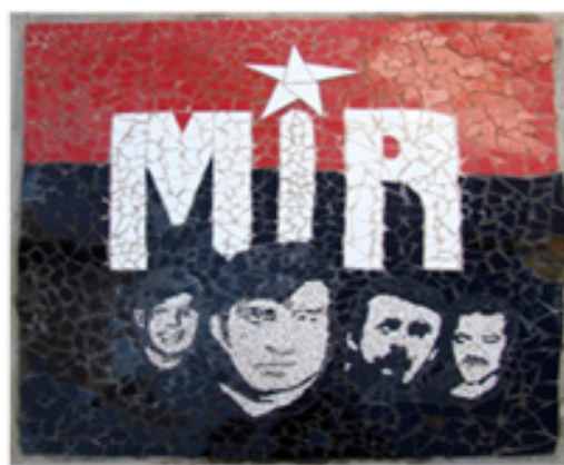
Imagen 5. Interpretación de mosaico 10

Por otro lado, los niños y niñas también desplegaban performances de recuerdo como el juego, la búsqueda y la imaginación. En la Imagen 3 podemos ver un grupo de niñas que recorre el Memorial buscando mosaicos. En estas búsquedas, las niñas corrían por el Memorial e inventaban historias sobre los mosaicos y las personas recordadas en ellos, acciones que destacaban por su carácter lúdico. El reconocimiento de estas prácticas nos muestra que hay otras formas de habitar el espacio y de participar en los procesos de memoria, propias de los niños y las niñas, ampliando así los significados y acciones con los cuales recordar.