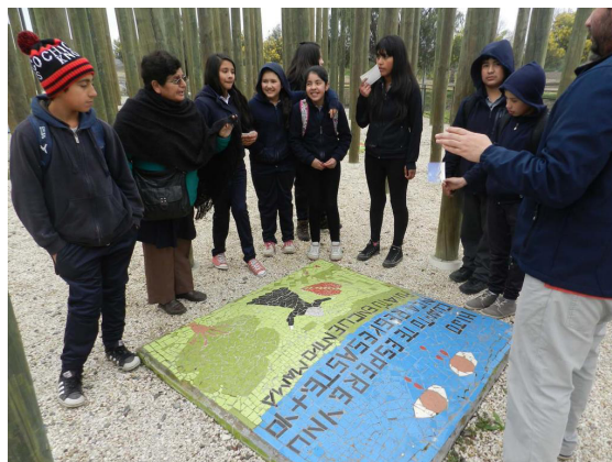
Imagen 3. Niñas y personas adultas conversando sobre un mosaico

En ese sentido, las relaciones cooperativas permitían que el espacio se volviera significativo y abierto para conocer y compartir las memorias de los distintos actores, dando lugar a que los niños y niñas expresaran sus propias concepciones sobre el pasado, nutriendo con experiencias diversas el relato de memoria que se hacía durante el encuentro. Para ello, era importante que tanto niños y niñas como sujetos adultos presentes se encontraran abiertos al diálogo, desplazando la posición de saber autorizado hacia la construcción de un saber intergeneracional que comprende su riqueza en tanto responde a diversas fuentes de experiencia. Por su parte, la posición de agencia en la que se situaban los niños y niñas durante el ejercicio de memoria establecido por medio de estas relaciones cooperativas, propiciaba su compromiso con los propios objetivos del espacio, así como los del equipo a cargo. Luego de un encuentro particularmente participativo 8 , las niñas manifestaron su intención de difundir en su comunidad y familia lo que habían aprendido en el Memorial, con el fin de transformar la visión negativa que existía en Paine sobre el espacio 9 . De esta forma se puede ver que este tipo de relaciones desestabilizan las maneras normadas de hacer memoria, ya que los niños y niñas pueden desenvolverse como actrices relevantes al ser protagonistas de sus acciones y elaboraciones tanto sobre el pasado como sobre el presente.