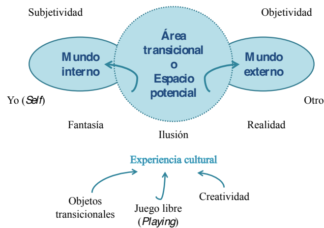
Figura 1 El área transicional de Donald Winnicott (1971)

Una línea de investigación educativa francesa ha vinculado el área transicional con los saberes escolares. Esta se ha centrado en la relación con el saber y con el aprender para