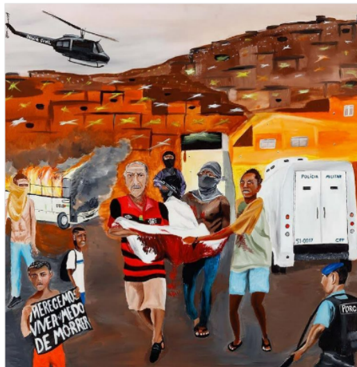
Figura 6 Bala achada

Nota. 100 x 100 cm. Reproducida bajo el amparo de las leyes colombiana (Ley 23) y brasileña (art. 46 Lei 9610 de 1998) en tanto que su uso corresponde a una investigación científica, es un uso honrado (de un bien no comercializable) y su difusión en la revista no tiene ánimo de lucro.