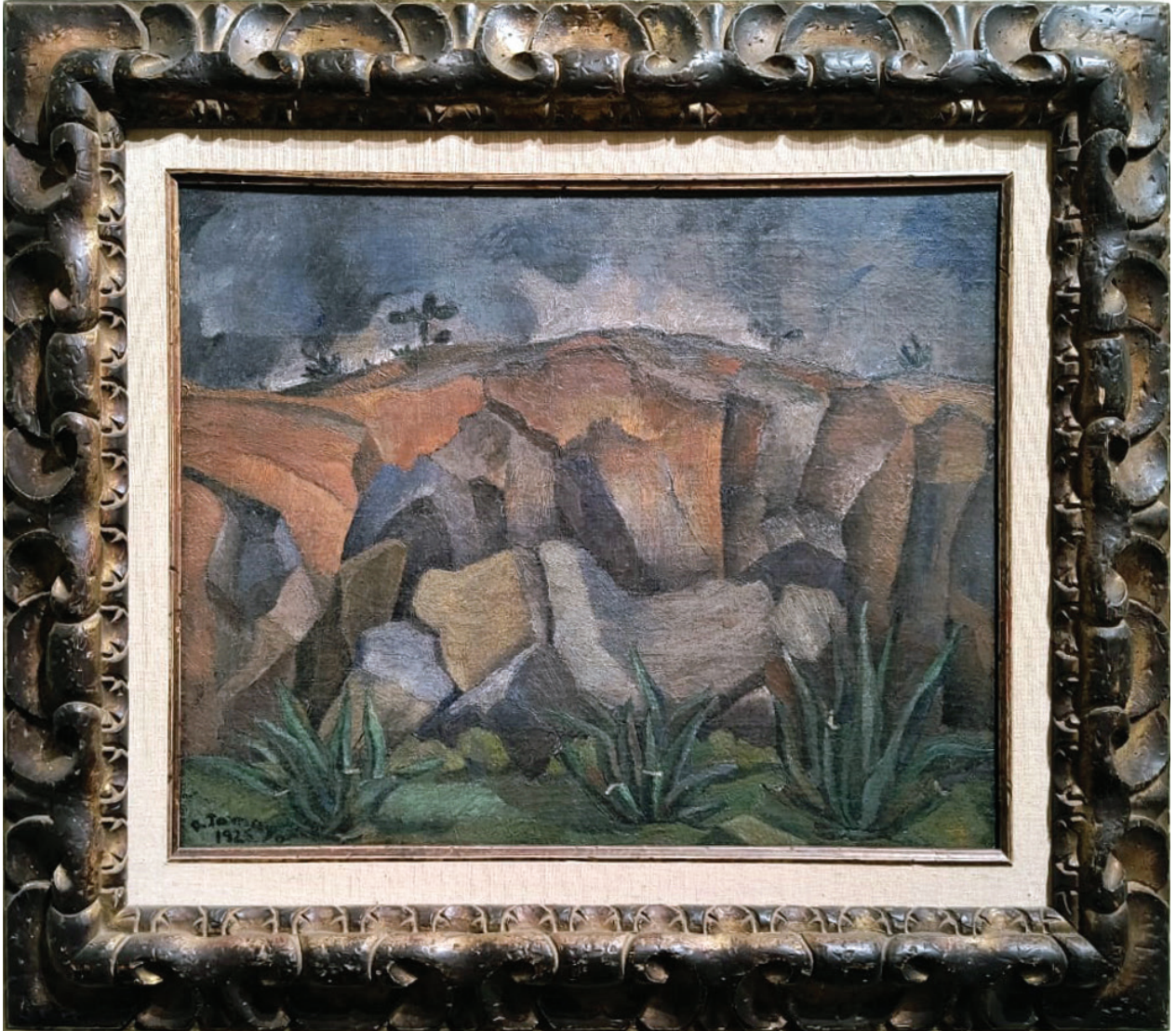
Figura 2. Rufino Tamayo, Paisaje con rocas , 1925, Museo Tamayo Arte Moderno, Ciudad de México, col. Museo de Arte Moderno, INBA-Conaculta.

Óleo sobre tela (39.5 x 49.5 cm) de Rufino Tamayo. La obra es significativa en el arte moderno mexicano y en la trayectoria del artista.