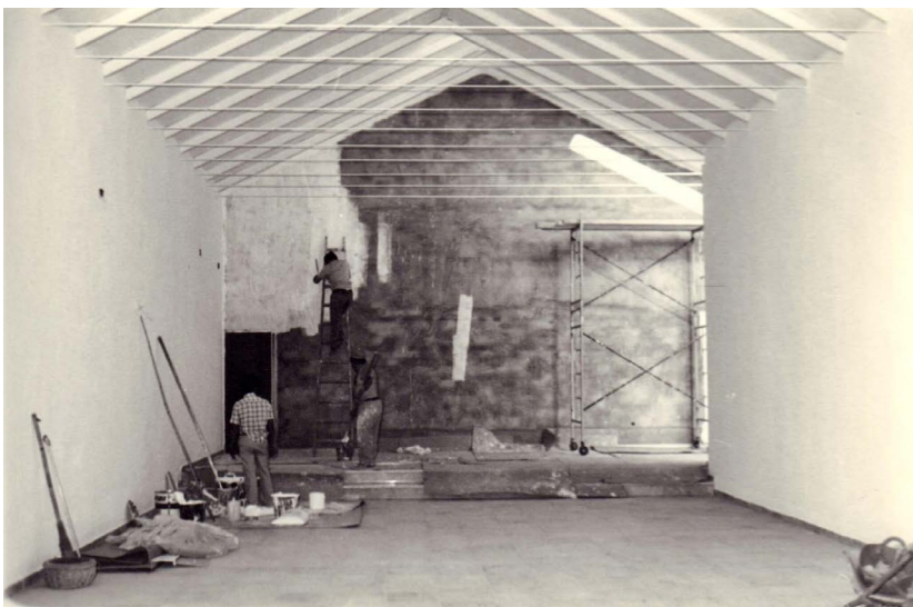
Miembros de la Hermandad de Santiago trabajando en la construcción de la ermita (1983).

trabajando día a día y solventando los problemas según iban surgiendo. 18 Lo que sí se ha conservado en el archivo personal del arquitecto es una interesante colección de alrededor de cincuenta fotografías que sirven para documentar todo el proceso de construcción. En la parte posterior de ellas aparecen una serie de anotaciones del propio Fisac que nos permiten acercarnos a los pormenores de la singular historia del edificio. 19