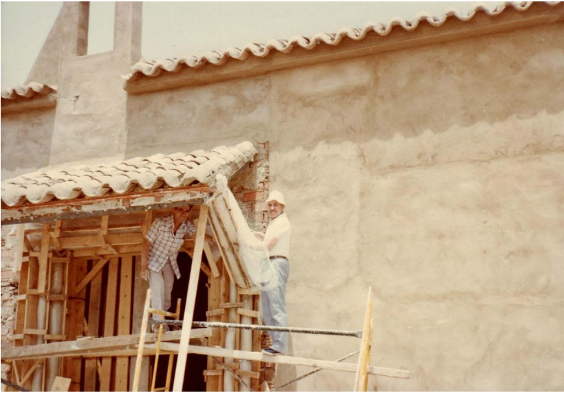
Miguel Fisac en el andamio durante la realización de los encofrados (1983).

se conseguía una pieza de hormigón que presentaba abombamientos, pliegues, arrugas e irregularidades que ofrecían un efecto novedoso. Además, para su elaboración no era necesaria una mano de obra cualificada y se obtenía de manera económica debido a los bajos costes de los elementos que formaban los moldes. Si analizamos las fotografías que se custodian en el archivo del arquitecto encontramos algunas donde vemos al propio Fisac subido en un andamio trabajando en la realización de los hormigones flexibles de la ermita. En ellas se puede observar los bastidores del armazón, realizados con tablas, que contenían en su interior el polietileno para dar forma al hormigón del pilar.