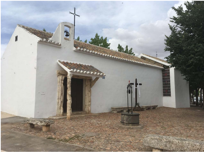
Ermita de San Pedro en Almagro (2019).

posteriormente se sistematizaron tras el Concilio Vaticano II. 9 Varias de estas soluciones estaban ya presentes en el conjunto del Teologado de los Padres Dominicos en Madrid (1955), una de sus obras más famosas y divulgadas. La arquitectura religiosa del arquitecto despertó el interés de revistas de la época en las que sus edificios e ideas fueron ampliamente difundidos.