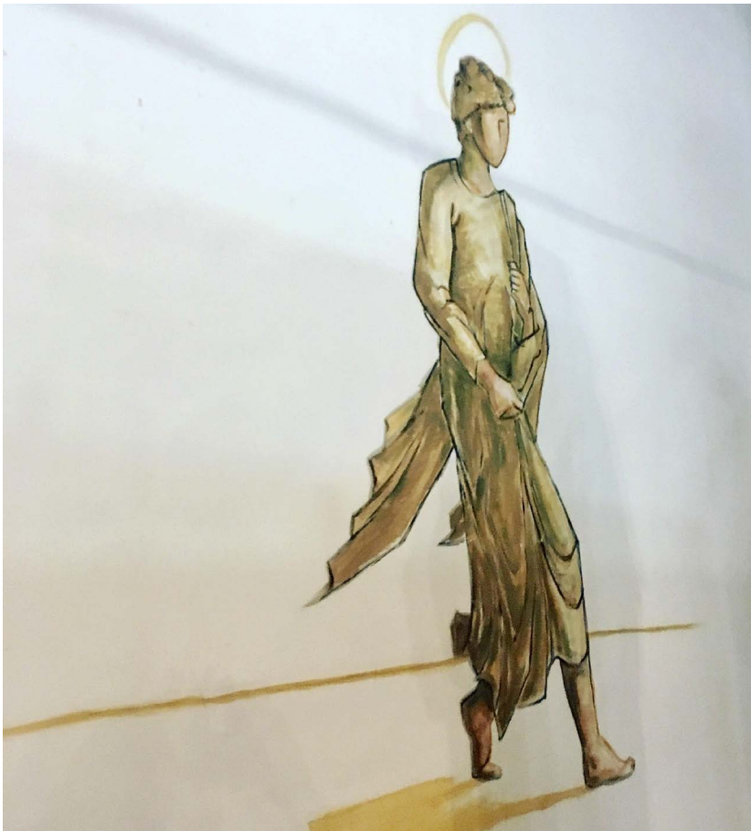
Detalle de las pinturas murales (2019).

arquitectura de la Academia Artaquio. El conjunto se completó con pinturas murales en el altar ejecutadas por el propio Fisac, como se puede observar en varias de fotografías donde aparece el arquitecto subido a una escalera durante su realización. En ellas se muestran tres escenas relativas a la vida del apóstol Santiago: un grupo que recuerda su oficio de pescador cuando fue reclutado por Cristo, una representación de Santiago Matamoros (que se vincula con la importancia que ha tenido para Almagro la Orden de Calatrava) y al apóstol trasladándose a Occidente para predicar la nueva fe. Unas figuras creadas en tonos ocres que destacaron por un diseño basado en líneas rectas y planos lisos, así como la ausencia de cualquier elemento superfluo.