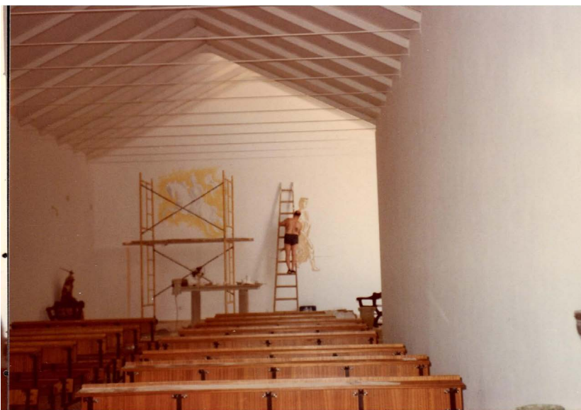
Miguel Fisac durante la realización de las pinturas murales (1983).

Las iglesias de Fisac solían estar presididas por un crucificado acompañado por una imagen de María entre el ambón y la sede. En ocasiones incluía algunas más como los titulares del templo en el acceso. 35 Esta propuesta es seguida en la ermita almagreña colocando una sencilla cruz de madera en el altar acompañada de la Virgen y de Santiago en el presbiterio y una de San Pedro frente a la entrada.