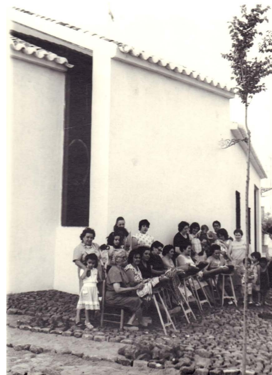
Vecinas realizando encajes para la ermita (1983).

Fisac solía disponer pocas imágenes en sus templos, de hecho, animaba en sus textos a la colocación de las mínimas posibles tomando de referencia la limpieza ornamental de la cultura japonesa. En sus diseños buscó utilizar soluciones similares al “tokonoma” que respondía al gusto por espacios limpios, tan contrario de la costumbre occidental.