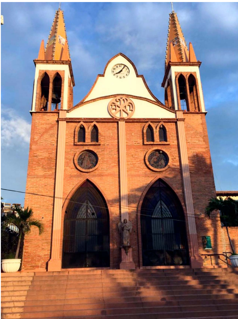
Figura 4. Fachada exterior del templo de Nuestra Señora del Refugio de Puerto Vallarta.

arcuaciones ojivales que rememoran al remate o pretil gótico. Sobre ellas se levanta un frontón de dos niveles pintado de blanco; el primer nivel está limitado por un arco rebajado con un lábaro circular con el alfa y el omega en cantera de piedra clara; el segundo se limita con arco engolado y su centro se sitúa un reloj mecánico. El mencionado frontón se trata de una estructura constructiva que, más allá de lo decorativo, sirve para guardar la maquinaria del reloj.