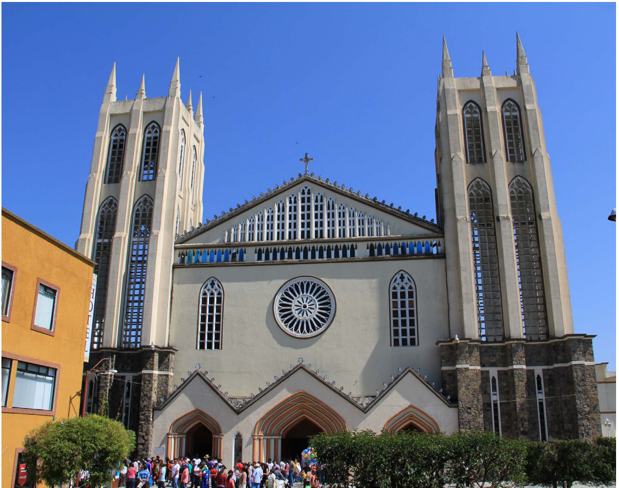
Figura 8. Vista fachada principal del templo de San Juan Bautista en Xicoteppec de Juárez, Puebla. Fotografía: MCA, febrero 2013.