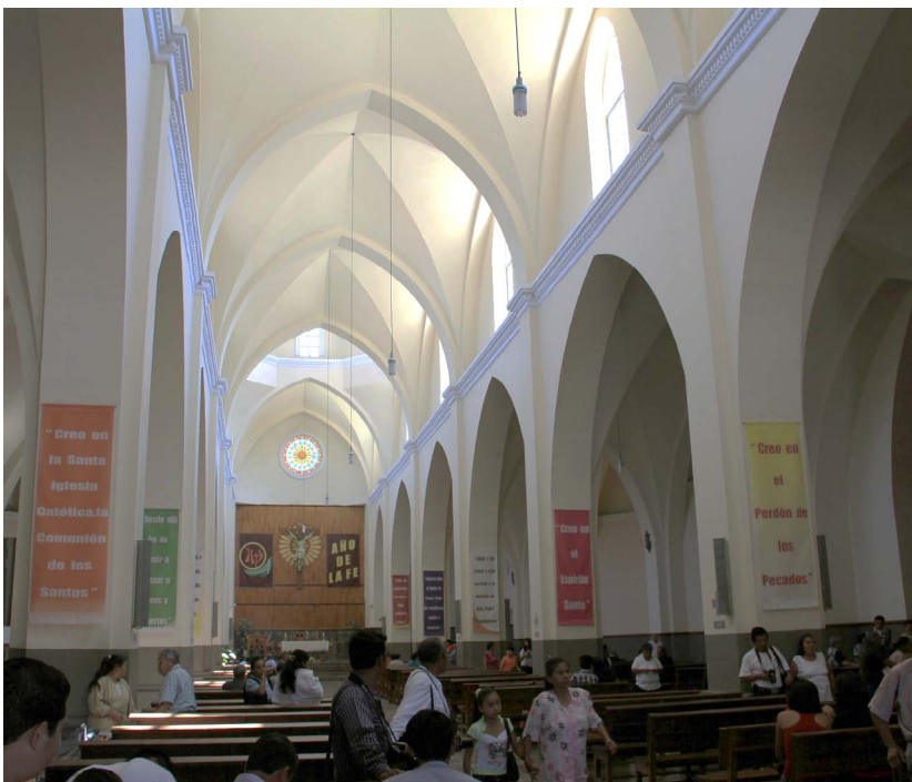
Figura 9. Vista del interior del templo de San Juan Bautista en Xicotepec de Juárez, Puebla. Fotografía: MCA, febrero 2013.

por las necesidades constructivas, la falta de recursos materiales y económicos y por el carácter social que un templo tiene para aquellos que se sienten su feligresía, la cual es capaz de contribuir activamente a su construcción a lo largo del tiempo. Igualmente, en ambos casos, se resuelve la importancia que tiene el accionar de un sacerdote en aras de levantar un templo. Un hecho que, aunque obvio, se repite en numerosos ejemplos, tanto en estilo neogótico como en otros, a lo largo del país y también en otras geografías. El análisis de ambos ejemplos demuestra lo ya conocido, la arquitectura es una actividad de interacción social en busca de edificar espacios para diversas funciones y que, en el caso de una iglesia o un templo católico, requiere de la participación activa de quienes creen y son parte del culto religioso.