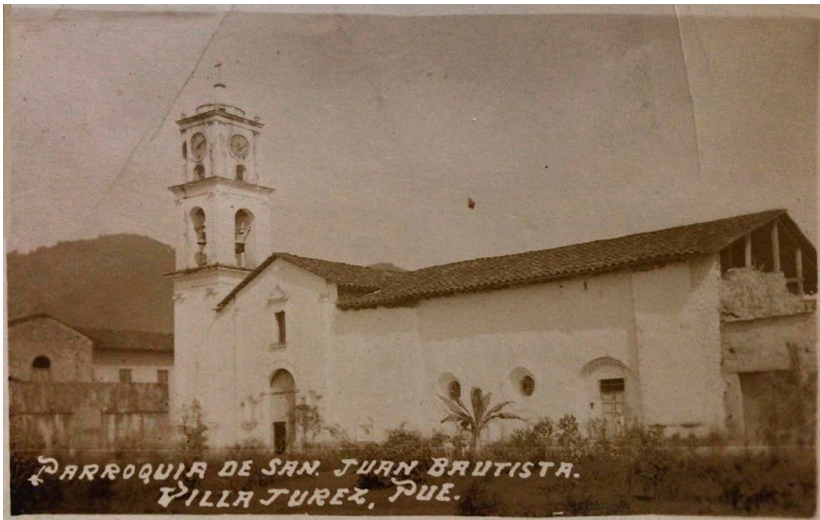
Figura 6. Vista de la antigua parroquia de San Juan Bautista en Xicotepec de Juárez, derribada para construir el nuevo templo. Fuente: Reyes, Un ángel para los pobres , 86.

como prueba la celebración del Segundo Sínodo Diocesano en 1945, que dictó nuevas formas de funcionamiento en las parroquias de la diócesis. Se trató de una estrategia de “recatolización” de la sociedad que pasaba por la creación de núcleos de la Acción Católica y el incremento de actividades religiosas tanto personales (otorgamiento de sacramentos y confesiones) como públicas y multitudinarias (procesiones, misiones, peregrinaciones, etcétera), actividades a las que el Padre Panchito se dedicó con especial empeño en la parroquia xicotepense.