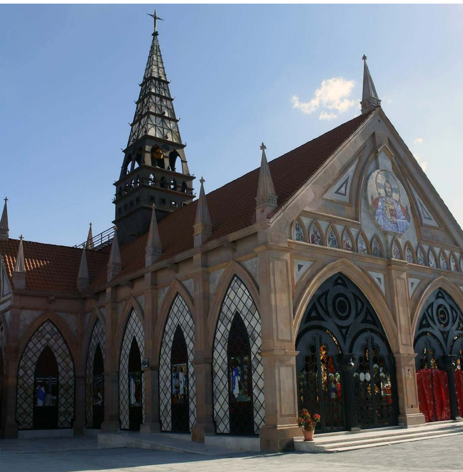
Figura 3. Parroquia de San Antonio de Padua, Nacajuca, Tabasco. Fotografía: MCA, febrero de 2012.