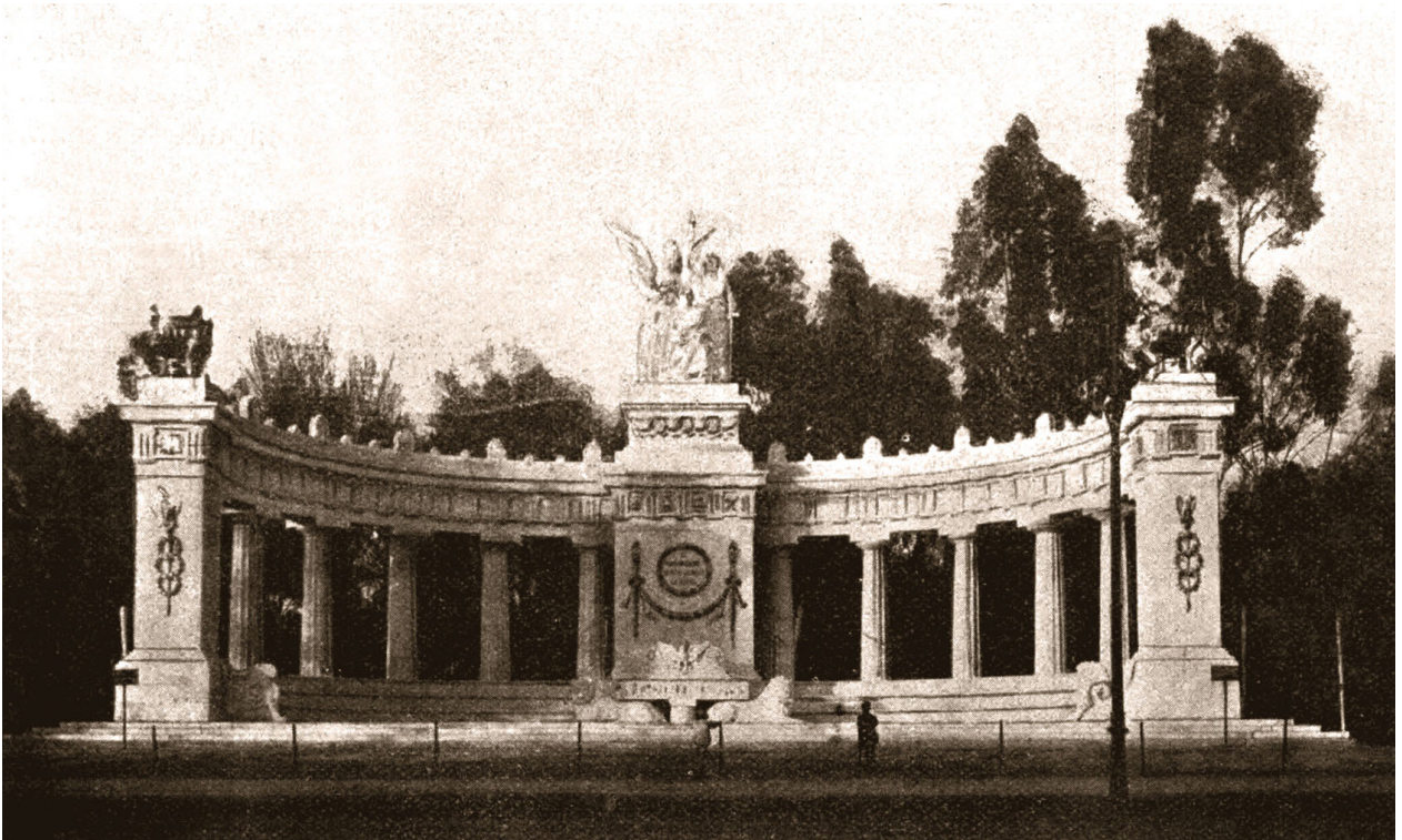
Figura 10. Fonds Bétons armés Hennebique 076 IFA 139, publicada en "Le béton armé au Mexique», Le béton armé , 169, 1912, p. 88.