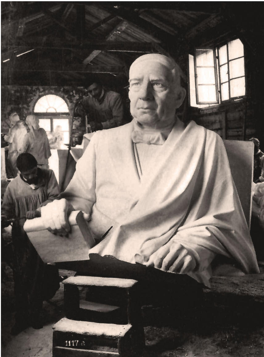
Figura 9. Luisa Passeggia, Lo studio Lazzerini. Viaggio a Carrara in tre secoli di storia , 2012, p. 193.

Además de la competencia contra el tiempo, se desprende de estos datos que si el mármol pesó 1,400 toneladas y el total del monumento, según lo publicado el 18 de junio, era de 1,700, entonces la estructura de concreto armado resultaba el componente más liviano del conjunto. Aun sin ser datos exactos, se aprecia una diferencia importante entre el peso de los componentes de mármol y la estructura que los soporta. Las imágenes de la hemerografía disponible no retrataron el proceso de transporte de las pesadas piezas, algunas de dimensiones colosales, desde el puerto de Livorno hasta Veracruz, puertos cercanos al taller donde fueron talladas y al destino de las piezas, sino desde la estación Buenavista del Ferrocarril Mexicano, donde presumiblemente llegarían, hasta la Alameda Central.