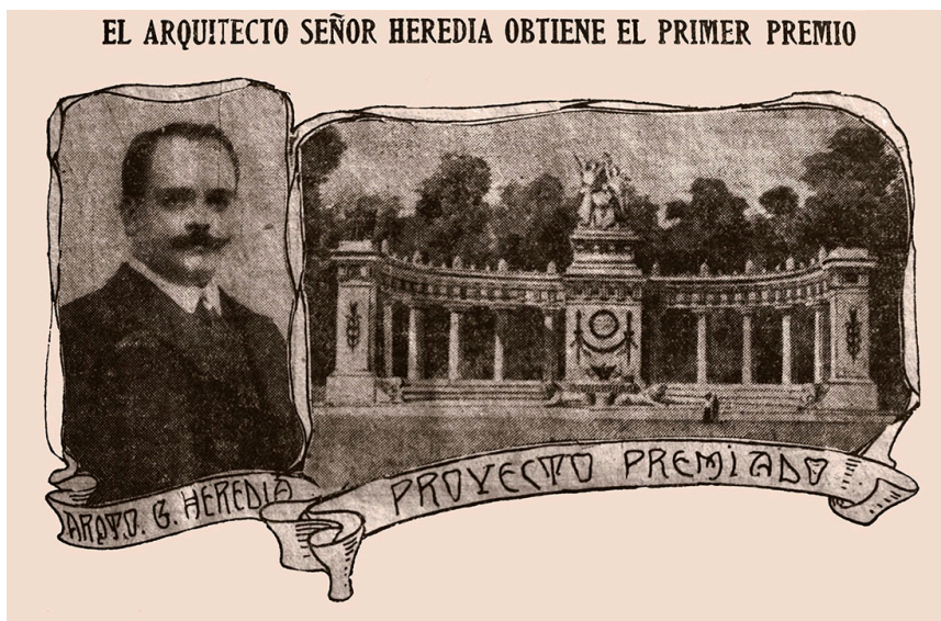
Figura 5. “El jurado calificador falla en los proyectos del Monumento a Juárez”, El imparcial , 13 de julio de 1909, p. 1.