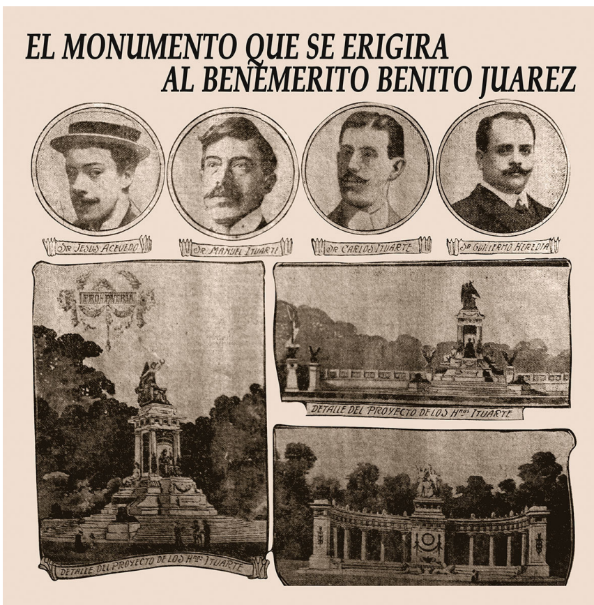
Figura 4. “El monumento que se erigirá al benemérito Benito Juárez”, El imparcial , 3 de julio de 1909, p. 8. A la izquierda la propuesta de los hermanos Manuel y Carlos Ituarte, arriba y a la derecha la de Jesús Tadeo Acevedo y abajo la de Guillermo Heredia.

con otros monumentos podría haber llamado la atención de los concursantes al monumento a Juárez. La forma y la función eran excelentes para un jardín como la Alameda Central. A la función clásica original como lugar de pláticas, atinado para un político de la talla de Juárez, se añadía la forma ya asumida como tipo monumental durante el siglo XIX. 29