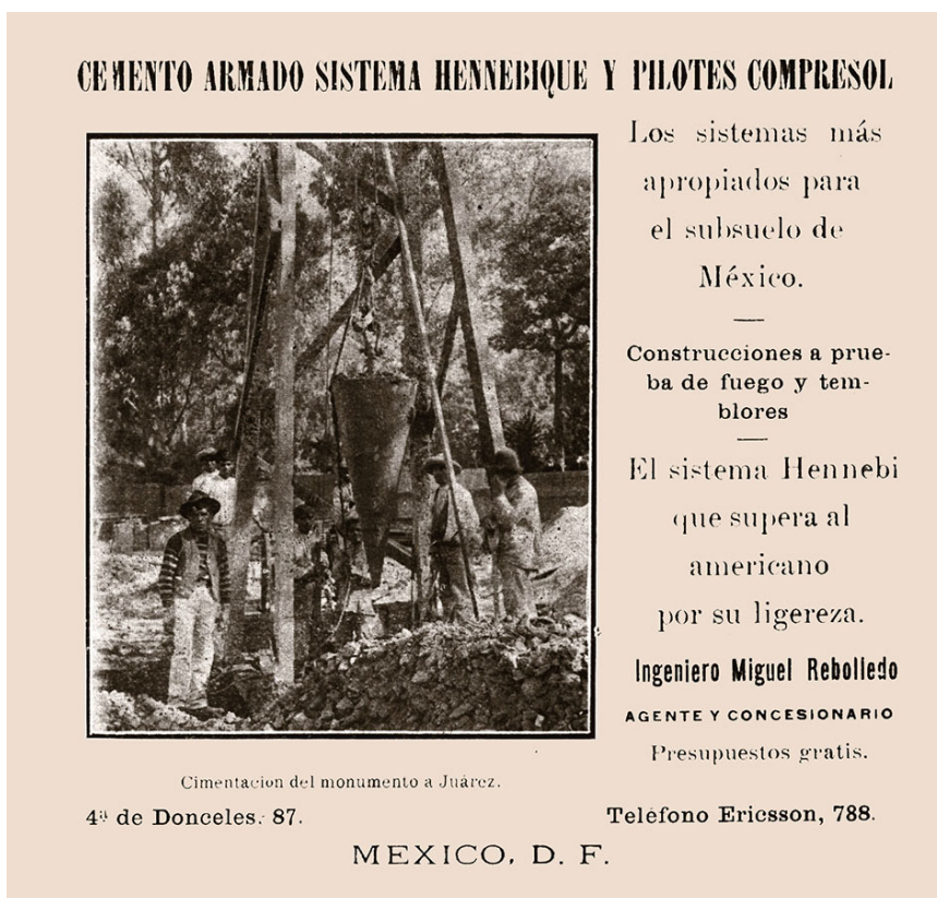
Figura 6. Aviso en Revista de ingeniería , mayo 1913, p. s/n.

La realización del monumento a Juárez estaba resultando un gran logro para la ingeniería mexicana y en poco tiempo las imágenes de su cimentación fueron protagonistas de los anuncios del ingeniero Rebolledo. La escultura, la arquitectura y ahora la ingeniería contribuían con importancia equivalente para el éxito la obra en vía de finalización. En cualquier caso, la gestión de la obra fue un ejercicio notable para la construcción en el débil subsuelo capitalino al que se sumaba el reto al tiempo que transcurría hacia la fecha comprometida.