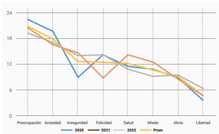
Figura 2. Porcentaje de respuesta a los sentimientos experimentados durante el confinamiento.