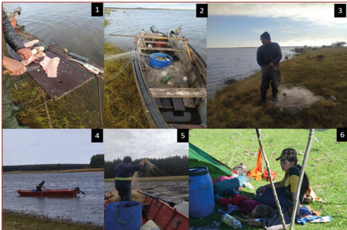
Figura 2 – Actividades de la pesca artesanal