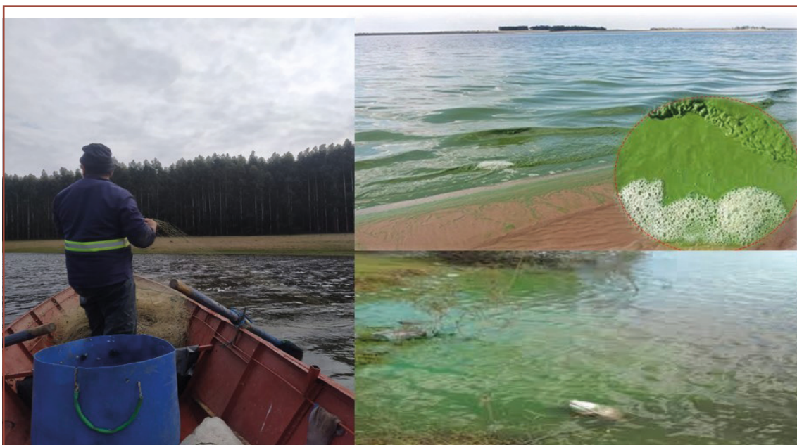
Figura 4 – Actividades del agronegocio en el territorio de pesca artesanal