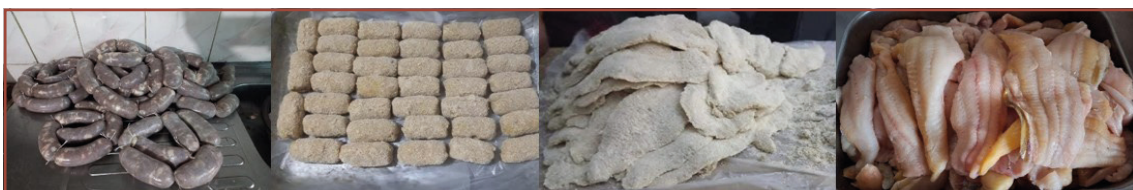
Figura 3 - Productos que le dan valor agregado al pescado