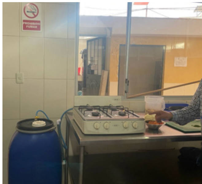
Figura 4. Presentación producción biogás

Nota: Durante 4 meses se degrado los residuos orgánicos, demostración del funcionamiento.