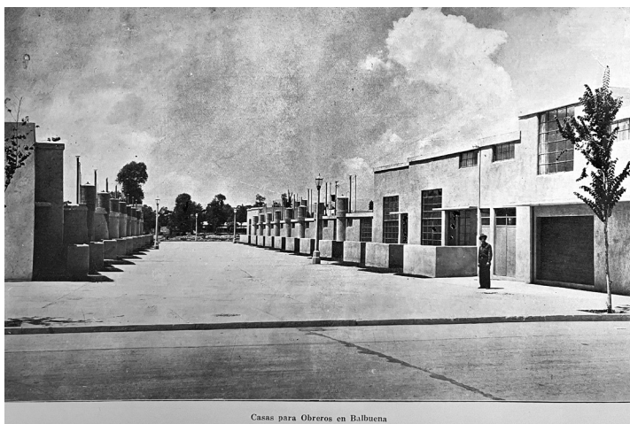
Figura 1. Casas construidas en Balbuena, en Ciudad de México, resultado del concurso de vivienda obrera de 1932

Fuente: Sáenz (1934). Disponible en la Mediateca INAH, Colección Archivo Casasola - Fototeca Nacional MID: 77_20140827-134500:87380. Autoría de Casasola, 1930.