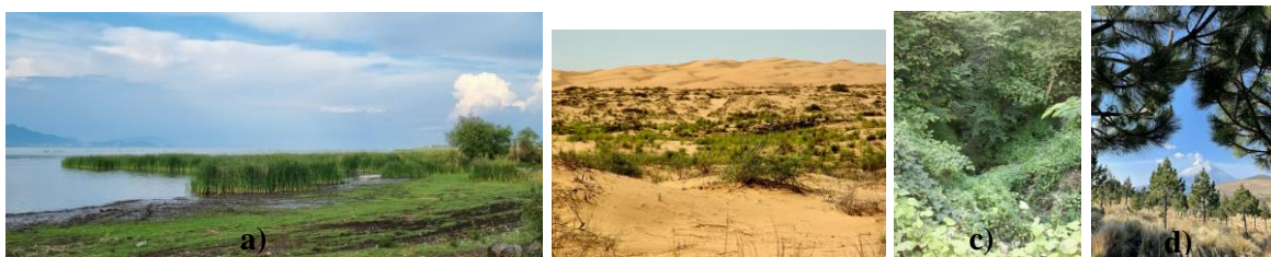
Figura 2. Diferentes tipos de ambiente y vegetación: a) lacustre, b) desierto, c) selva baja y d) bosque de altura

Los indicios botánicos se pueden encontrar en el sitio del crimen, en el cuerpo de la víctima y del presunto sospechoso, así como en sus pertenencias. Por ejemplo, las hojas y semillas pueden adherirse en la ropa o el cabello de la víctima o del victimario y permiten precisar los lugares en los que estuvieron, ya que existen plantas particulares para cada tipo de ambiente y vegetación (Figura 2). Las raíces de los árboles pudieran ayudar a determinar el tiempo que lleva un cuerpo enterrado, éstas se pueden encontrar enredadas en las extremidades del individuo y al analizar los anillos de crecimiento de las ramas del árbol y conocer la tasa de crecimiento de la especie vegetal en cuestión se estima el periodo de tiempo (Nassar, 2000; Martínez, 2019).