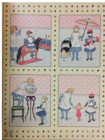
Imagen 4. Niños en el recreo

y reciben postres como frutas, dulces o pan, los niños suelen guardar sobras en los bolsillos y con ello alimentan luego a los pájaros. Salen de paseo para el que se preparan con elegancia: las niñas con sus vestidos, sombreros y velos y los niños de marineros, también con sombrero. Los juegos en la calle son el volante (con aros y palos), los caballos (imitación del carruaje). Meriendan a las cuatro algún pastelillo. Visitan a sus amigos a la hora de la comida y pasan la tarde en compañía, las niñas siempre son buenas anfitrionas: preguntan por la familia y la salud de los mismos, acogen a los invitados y los guían. Juegan en sus habitaciones esperando el llamado a comer. Cuando asisten a bailes se visten aún con más elegancia, juegan a las rondas y bailan lo que se toque como polkas o rigodones, cantan canciones como Mambru se fue a la guerra , toman refresco o helados, tocan sifón y duermen en las piernas de sus madres. Los espectáculos que disfrutan son de los cirqueros ambulantes que entrenan mascotas o la linterna mágica que refleja caricaturas. Al dormir rezan arrodillados en reclinatorios o junto a su cama y piden por sus padres y las personas que conocen (s. a., 188[?]).