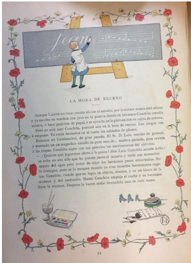
Imagen 1. Un niño jugando a la escuela