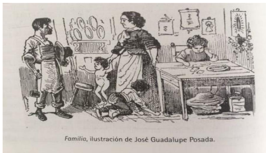
Familia , ilustración de José Guadalupe Posada.