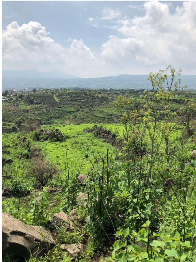
Figura 7: Variante de terrazas

tecorrales. Sitio en torno a Tecoxpa.