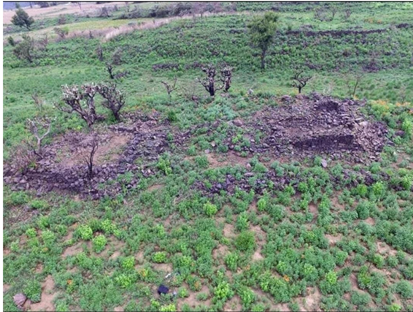
Figura 3: Terraceado de contorno en lomeríos en sitio Altepemilpan.