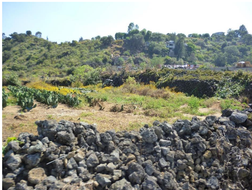
Figura 4: Terrazas de contorno y entre ellas de barranca, tipo presas, en San Pedro Atocpan.