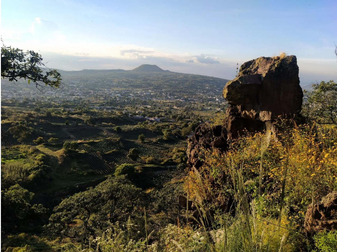
Figura 2: El paisaje agrícola, perspectiva de sur a norte.

Así es más claro que, además de lo anterior, el conocimiento desarrollado a través del tiempo de una tecnología de tal magnitud como lo es la conformación de terrazas, haciendo adecuaciones a las pendientes del terreno para tornar más eficiente la producción agrícola —entre muchos aspectos más que adelante se refieren—, al mismo tiempo haya sido implementado paralelamente a la necesidad de la búsqueda de nuevas tierras favorecedoras para el desarrollo de los pobladores que se fueron estableciendo y no sólo como resultado de la densidad poblacional que con el tiempo surgió en la zona lacustre; por todo ello considero que se alcanza un impulso muy fuerte en el sistema de terrazas observado a plenitud en el paisaje cultural de nuestra área de estudio. 3