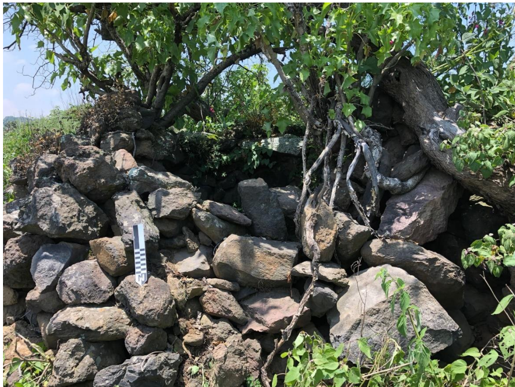
Figura 6: Probable cuarto-vigía en remate de terrazas. Sitio Altepemilpan.

de las terrazas en forma considerable por las alturas que llegan a presentar algunas (casi dos metros), intensificándose en este último sector, esto se debe fundamentalmente a la contención de las laderas, pero también resalta en algunos otros casos, sobre todo a las que miran hacia la parte exterior donde se visualizan los caminos reales de ambos lados del volcán Teuhtli (laderas este y oeste), el rematar con tecórbitos y sobre ellos, en determinados casos, la construcción en sus remates de pequeños cuartos a los que he denominado preliminarmente como cuartos-vigía (Figura 6) 11 , ya que la altura les permitía además de la vigilancia de los campos de cultivo, probablemente la de los accesos y caminos.