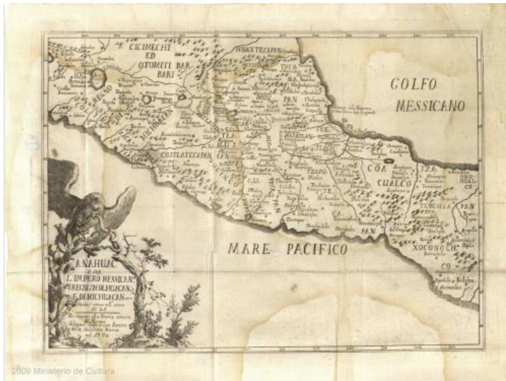
Figura 1. Mapa del Anáhuac. Tomado de Francisco Xavier Clavijero (1917), Historia Antigua de México

En el mapa arriba, se puede observar una reconstrucción de los territorios y fronteras que compartía el Imperio Mexica hacia el año de 1521. La obra fue elaborada durante el siglo XVIII por el jesuita Francisco Javier Clavijero. La cual, a pesar de ser creada siglos después, logró reflejar en un sólo documento, las crónicas e informes de muchas de las fuentes disponibles en la época, lo que la convierte en una consulta obligada al realizar estudios del Posclásico Tardío y Conquista española.