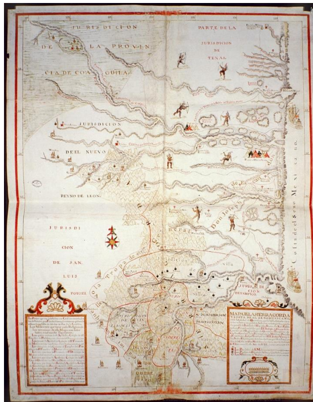
Figura 2. Mapa de la Sierra Gorda y Costa del Seno mexicano de 1747 por Joseph Escandón.

Lo que ocasionó que José Escandón tuviera más poder en la zona, causando más atropellos entre la población jonás que volvía a sublevarse, pero sin tener la empatía de antes, pues, debido a los años de vacas gordas que hacían fructíferas a las misiones, pocos se sumaron a las causas rebeldes.