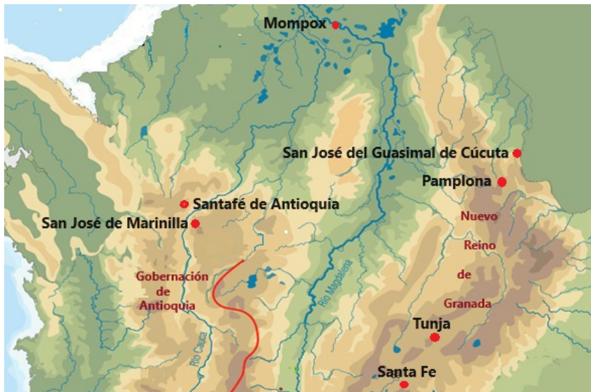
Mapa 1. Guasimal de Cúcuta y San José de la Marinilla, 1790