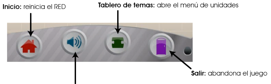
Figura 2 Menú de navegación

Volver a escuchar: repite la explicación del tema de cada unidad