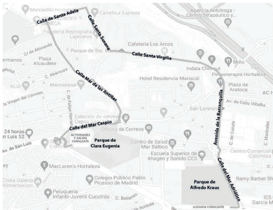
Mapa 3. Plano del itinerario de la cabalgata