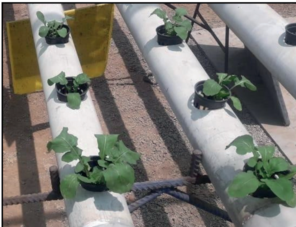
Figura 2. Plantas de arúgula hidropónica con deficiencias.