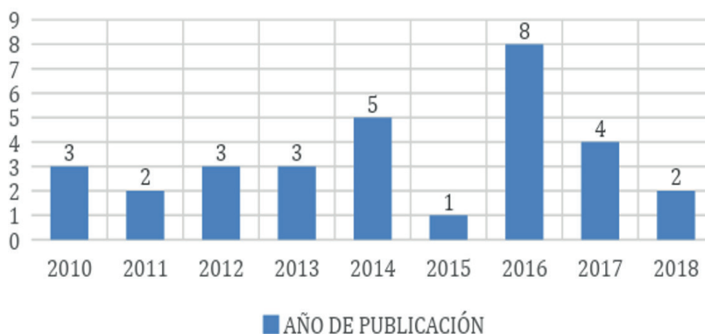
Figura 2. Año de publicación