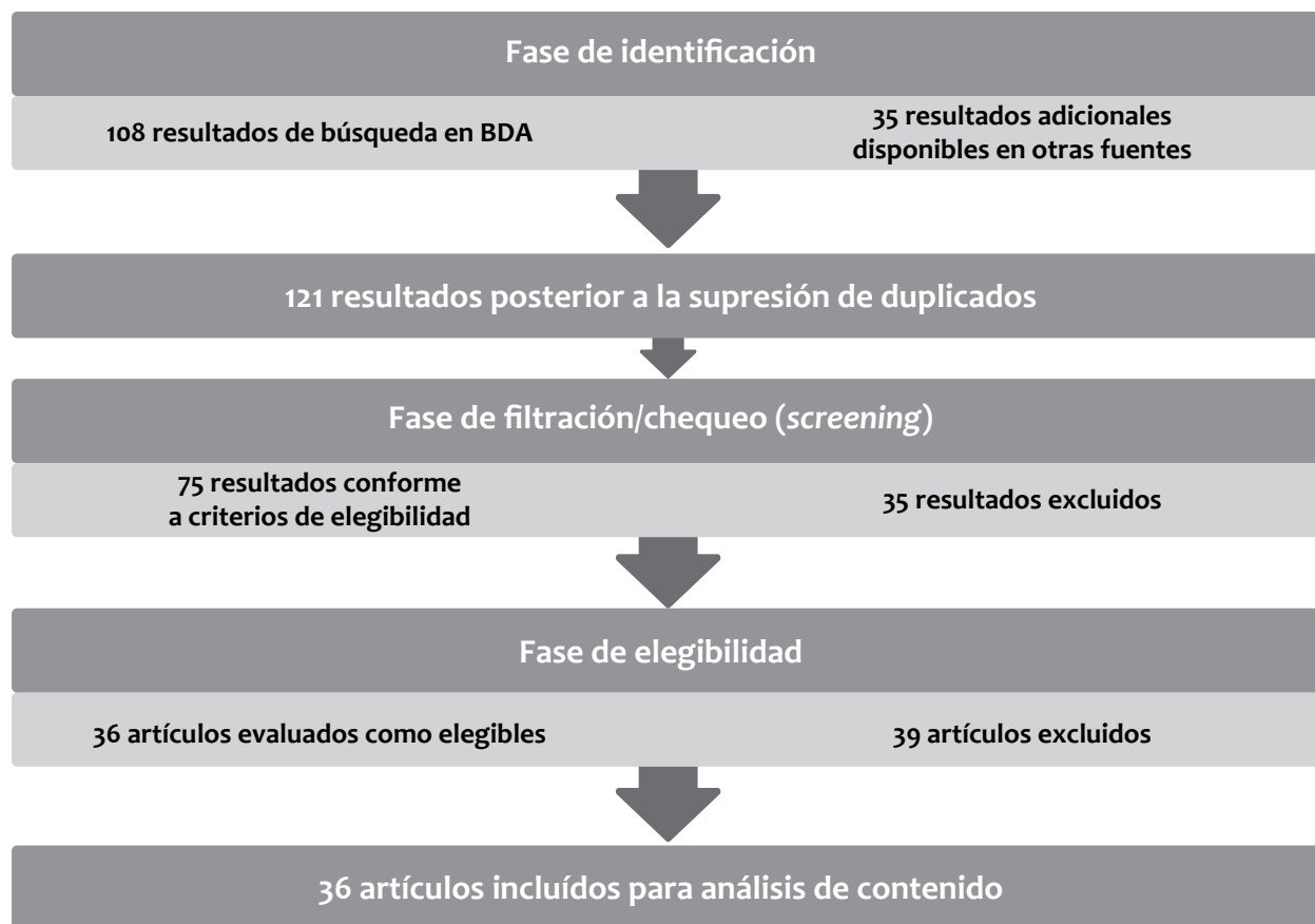
Figura 1. Proceso de selección de estudios para revisión sistemática

nube y relleno gracias al aporte de cada una de las personas responsables del estudio, permitió el volcado, revisión y edición de la información pesquisada en las bases de datos académicas (BDA). A la luz de lecturas iteradas de los materiales hallados en dichas búsquedas, fue posible establecer comparaciones en términos temático, de método y de resultados. En conjunto con la selección de categorías de análisis deductivas ampliamente expuestas y discutidas por estudios afines, se establecieron criterios de elegibilidad para seleccionar el corpus a analizar (Figura 1).