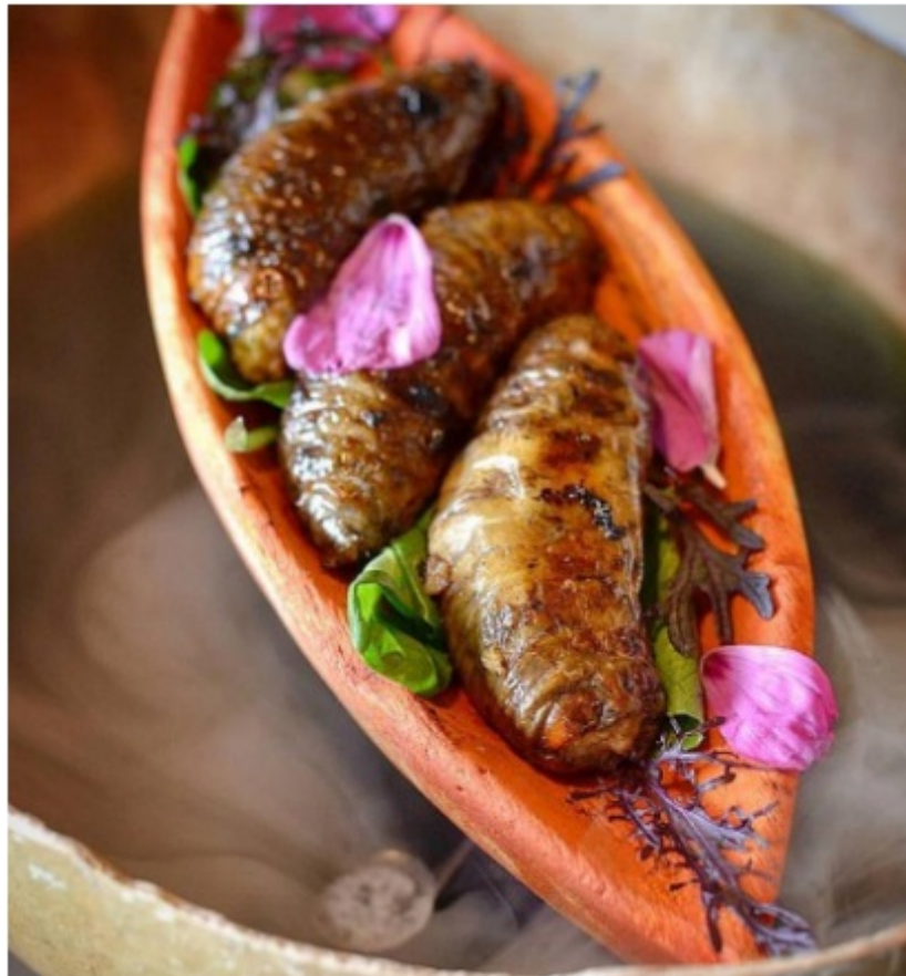
FIGURA 3 Plato “Pachamama” con larvas de R. palmarum .