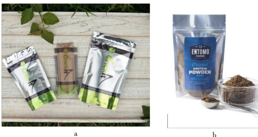
FIGURA 4 Harina de grillo de dos empresas comerciales en Colombia

La harina de grillo cautivo en el mercado, porque el protocolo para su elaboración es relativamente fácil, sugiere (acorde con Santamaria e Inga, 2019) que este proceso costa de seis fases: la primera es la selección de la materia prima, que deben ser los grillos completos; seguida de su congelamiento a 8 °C durante una hora; como tercera fase está el secado de la materia prima previamente congelada, se mantiene a una temperatura de 80 °C durante 24 horas; luego ser molida, ya sea por un molino de mano o industrial; como quinta fase, una vez se obtiene la harina, se realiza el secado a 80 °C durante ocho horas; finalmente se envasa la harina en bolsas de polietileno. Existe además estrategias de mercado en la cual mezclan la harina de grillo con otros componentes para generar variedad en el sabor y en su uso, es el caso de mezclarse con harina de maíz o soya (Barrios, 2017; Rivera, 2017).