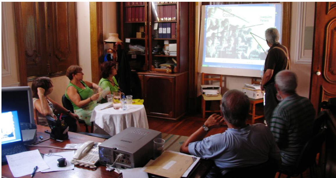
Figura 5. Grupo de Fotografia, Memória e Identidade do MuT