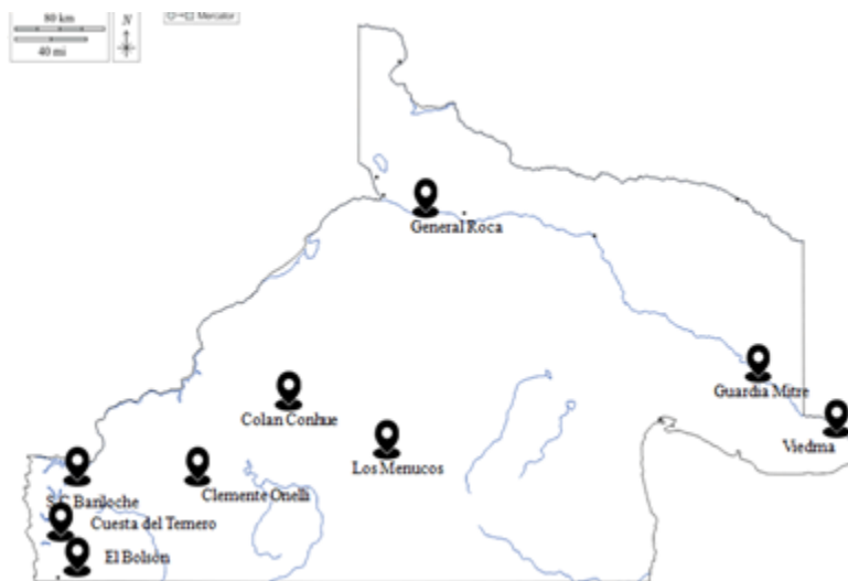
Recorrido laboral de Sabino Morales