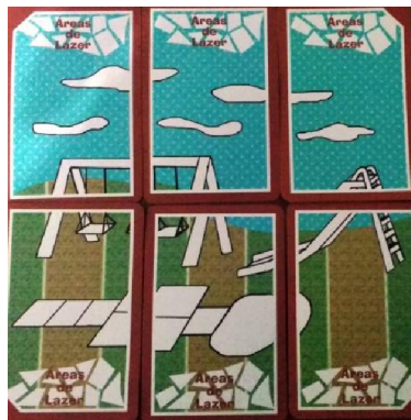
Figura 2. Ausência de lazer na cidade