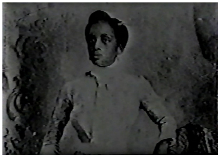
FIGURA 3. Frame. Madrina (personaje) Fuente: tomado de Guanabacoa , crónicas de mi familia (1966)

Esta cinta sirve como ejemplo para advertir otro pilar de la obra de Sara Gómez cuando del tratamiento de la alteridad se trata: el manejo de tipos, niveles e intensidades específicas del conflicto. Según Trisha Das (2007), el conflicto constituye un aspecto central en la arquitectura formal de un documental, dado que, sin este no habría progresión. Puede definirse como la contraposición entre los personajes y sus intereses, entre diversas posturas o creencias e, incluso, entre contrapuntos conceptuales o formales. Además, debe tenerse en cuenta que, como propone Fernández (2007), puede responder a los niveles siguientes: una persona contra sí misma, entre personas, entre una persona y un grupo, entre una persona o un grupo contra determinadas fuerzas opositoras (p. 60). La intensidad del conflicto estaría dada por su relevancia dramática a efectos de la temática principal y no por estos niveles. (figura 4). Así se permite diferenciar el conflicto principal de los secundarios.