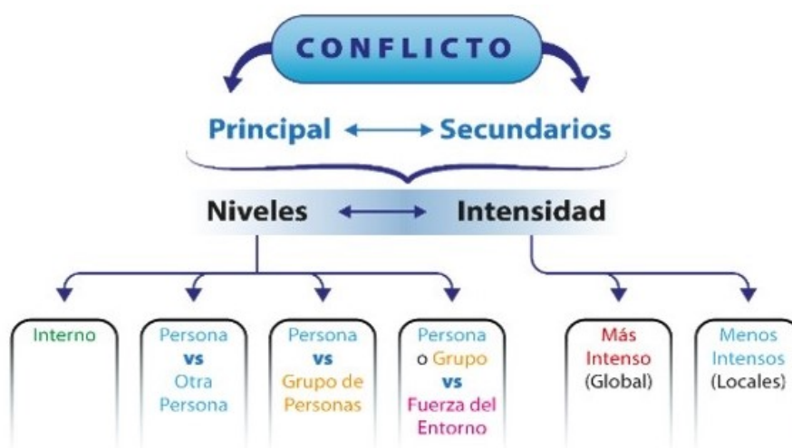
FIGURA 4. El conflicto

Esta cinta sirve como ejemplo para advertir otro pilar de la obra de Sara Gómez cuando del tratamiento de la alteridad se trata: el manejo de tipos, niveles e intensidades específicas del conflicto. Según Trisha Das (2007), el conflicto constituye un aspecto central en la arquitectura formal de un documental, dado que, sin este no habría progresión. Puede definirse como la contraposición entre los personajes y sus intereses, entre diversas posturas o creencias e, incluso, entre contrapuntos conceptuales o formales. Además, debe tenerse en cuenta que, como propone Fernández (2007), puede responder a los niveles siguientes: una persona contra sí misma, entre personas, entre una persona y un grupo, entre una persona o un grupo contra determinadas fuerzas opositoras (p. 60). La intensidad del conflicto estaría dada por su relevancia dramática a efectos de la temática principal y no por estos niveles. (figura 4). Así se permite diferenciar el conflicto principal de los secundarios.