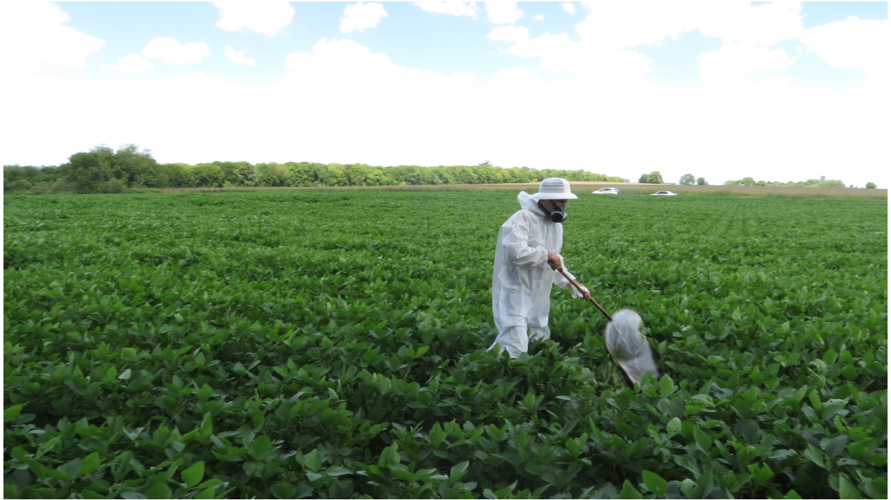
Figura 1. Capturas de artrópodos en canopia de cultivo con red entomológica.