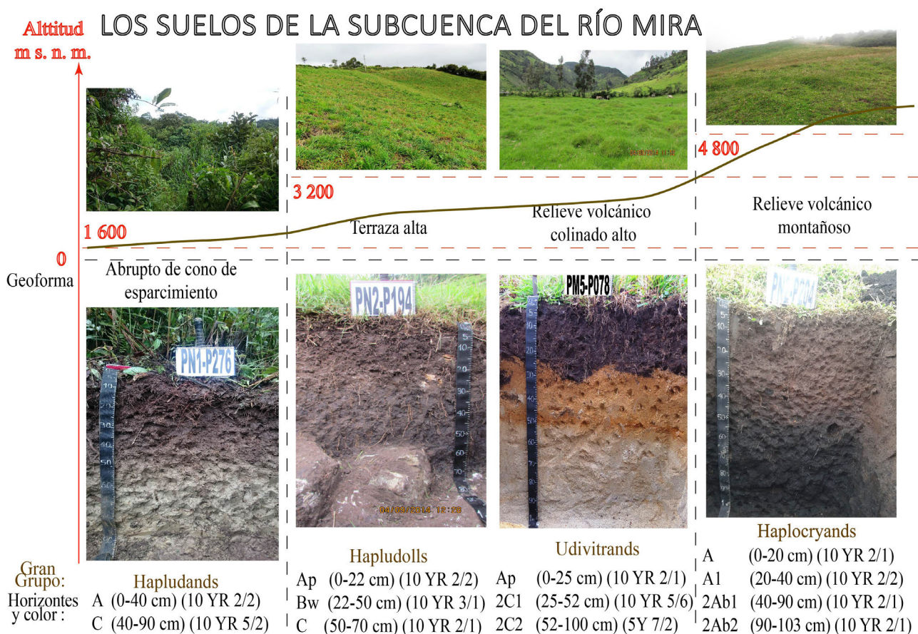
Figura 2. Distribución de suelos de la subcuenca del río Mira.

A partir de los resultados obtenidos de la fotointerpretación geomorfológica (Herrero, 1993) del área de estudio, la cual aporta con información referente a génesis, litología, geoforma y pendiente (Zinck, 2012) se inicia la caracterización edafológica, para ello, se determinaron los regímenes de tempe-