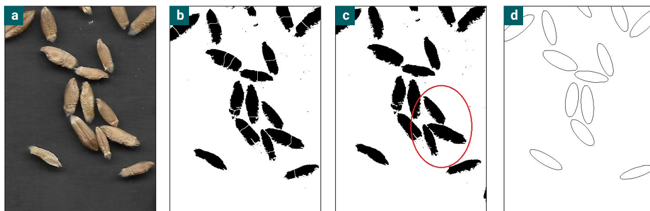
Figura 3. Ejemplo del procesamiento de conteo con granos dispuestos al azar (PAID DES ): (a) imagen original, (b) imagen segmentada por el algoritmo Watershed , (c) conteo de granos (el círculo rojo contiene los granos excluidos en el conteo), (d) elipse equivalente de los granos detectados.