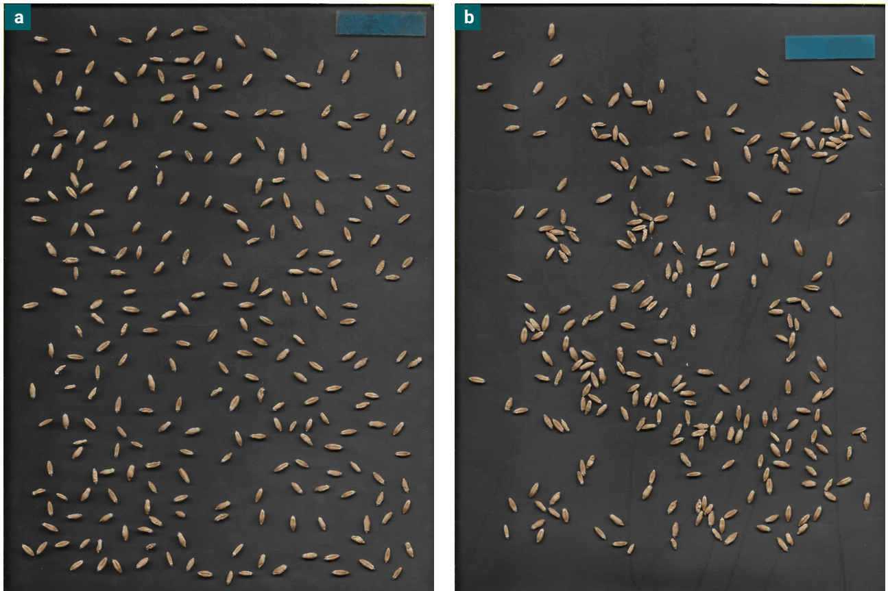
Figura 1. Distribución de los granos sobre el escáner para la digitalización: (a) disposición ordenada ( PAID_{ORD} ); (b) distribución azarosa o desordenada ( PAID_{DES} ).

El recuento y las dimensiones de los granos son variables que se obtienen la mayoría de las veces de forma manual o mecánica; sin embargo, estos métodos requieren de mucho tiempo, provocan cansancio, incremento del error y solo pueden analizar una cantidad limitada de muestras, en especial con granos de tamaño pequeño (Severini et al. , 2011; Whan et al. , 2014; Mussadiq et al. , 2015; Saucedo et al. , 2017); limi-