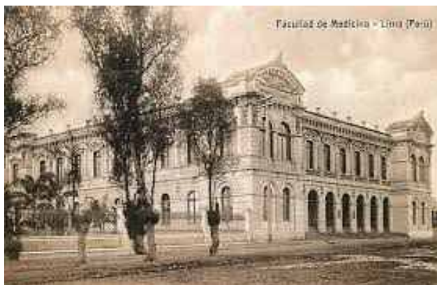
Imagen 3. Fachada de la Facultad de Medicina “San Fernando” de la Universidad Nacional de San Marcos, en Lima (1920)