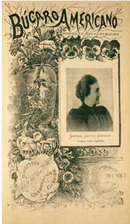
Imagen 5. Revista Búcaro Americano. Periódico de las familias (año 1, n.º 7 de 1896), con la doctora Cecilia Grierson, primera médica argentina, en su portada