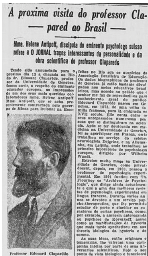
Figura 02: Recorte de “O Jornal” (1930)

Em “O Jornal” (RJ), de 10 de setembro de 1930, encontramos a notícia intitulada “A próxima visita do professor Clapared ao Brasil”. No texto, Hélène Antipoff é apresentada como a “discípula do eminente psicólogo suíço” e um “dos seus mais queridos colaboradores” a quem o jornal procurou para a realização da reportagem e que trazia traços biográficos do educador (FIGURA 02).