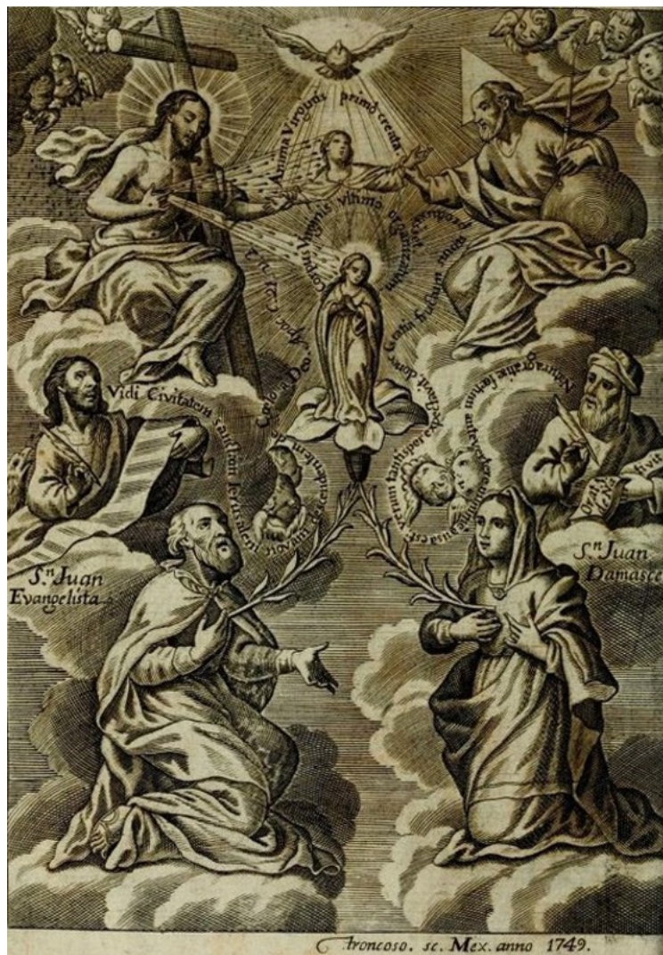
Imagen 7 El sagrado tallo (PESSCA) Baltasar Troncoso, 1749

Los otros tres cuadros en la predela del retablo de la Virgen de los Remedios tienen mejores soluciones en las proporciones y la perspectiva. Sin embargo, sus calidades son distintas en las representaciones de rostros, manos y ropajes contorneadas con lámina de oro. Estas últimas suelen ser hieráticas y rígidas como en La visitación y, pocas veces, representan algún movimiento. Éste es el caso del Arcángel Gabriel de La Anunciación y los ángeles testigos en Los desposorios (Imagen 2).