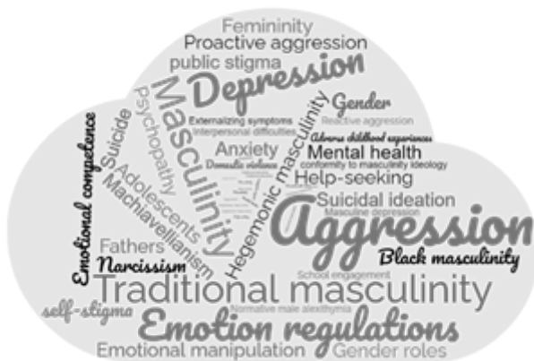
Figura 2. Nube de palabras que representa las palabras clave más utilizadas en los artículos seleccionados.

El proceso de revisión sistemática sobre factores causales y variables psicológicas en la masculinidad tradicional permitió identificar doce estudios originales (ver Tabla 1). Los resultados relevantes fueron identificar algunos posibles factores causales y variables psicológicas relacionadas con la masculinidad tradicional como: apoyo de amigos, búsqueda de ayuda, depresión, agresión, alexitimia, supresión, narcisismo, coerción e ideación suicida. Además de destacar que la