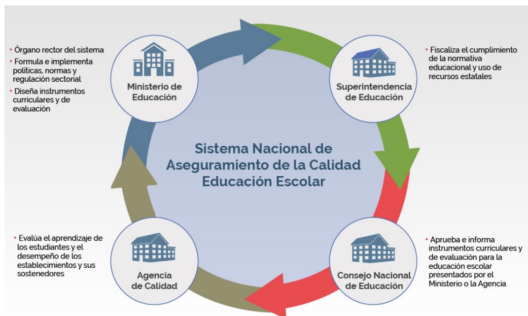
Imagen 1 - Institucionalidad del Sistema Educativo Chileno