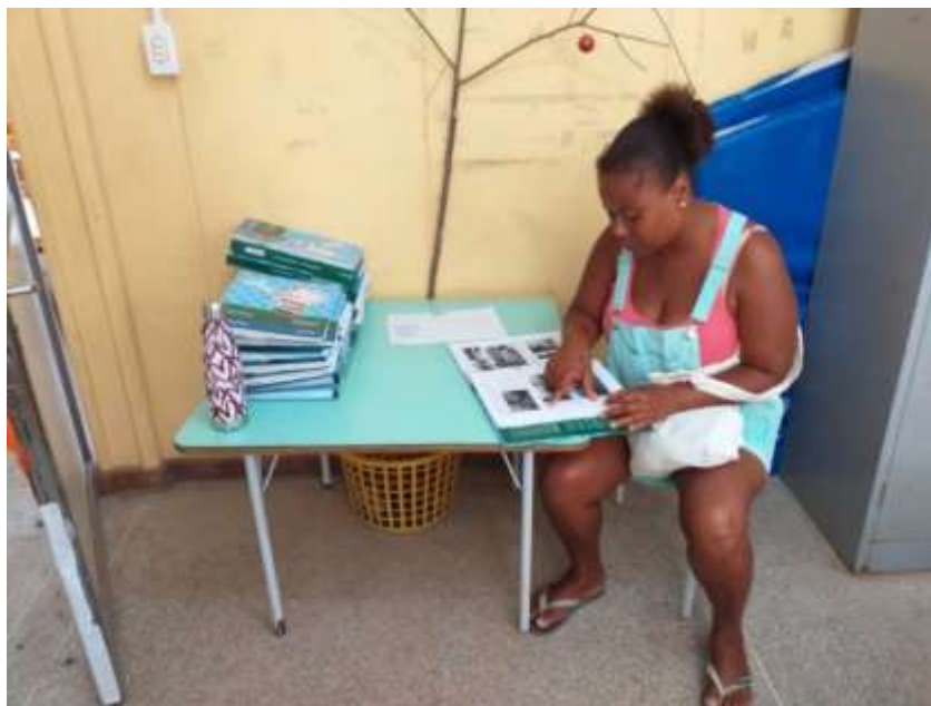
Figura 1 - Foto de uma mãe lendo o portfólio da sua filha (primeira cena) 3