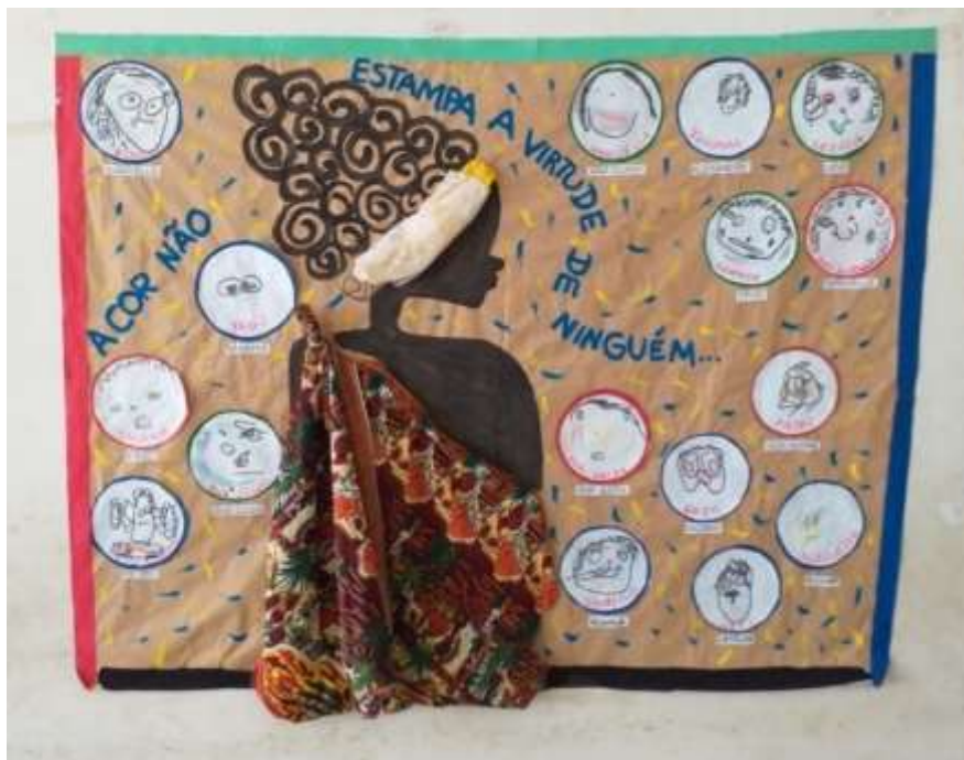
Figura 2 - Foto do mural da escola (segunda cena)