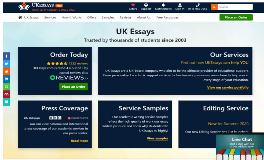
Figura 1. Captura de pantalla de un ejemplo de fábrica de ensayos: www.ukessays.com

La segunda tipología, a la que aquí nos referimos como probables fábricas de ensayos, cubre aquellos sitios que operan en los límites de la aceptabilidad pero que pueden vincularse o promover el fraude académico a través de contratos comerciales, por ejemplo alojando