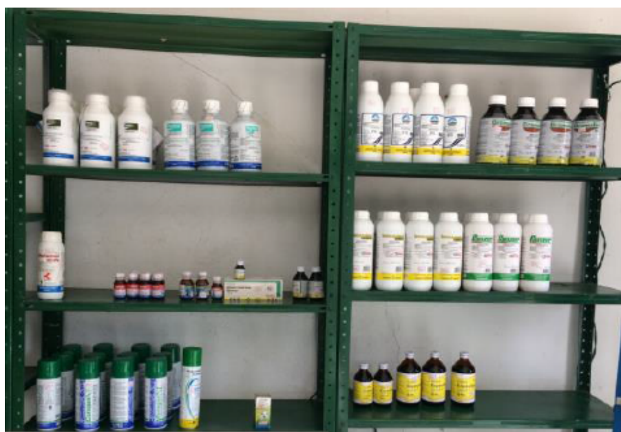
Figura 2 Pesticidas comercializados en el municipio de San Juan Nepomuceno.

Las características de enfermedad de Parkinson incluyen pérdida neuronal en áreas específicas de la sustancia negra y acumulación extensa de proteína intracelular ( \alpha -sinucleína). Aunque ni la pérdida de neuronas dopaminérgicas pigmentadas en la sustancia negra ni la deposición de \alpha -sinucleína en las neuronas son específicas para la enfermedad de Parkinson, estas dos neuropatologías principales son específicas para un