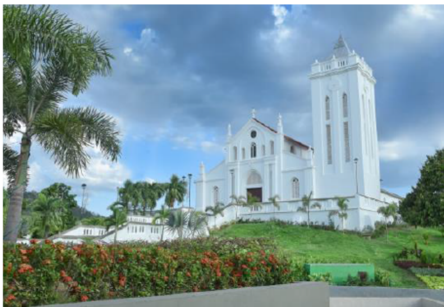
Figura 1 Iglesia Central en el municipio de San Juan Nepomuceno.

estudio taiwanés que mostró que la exposición al paraquat durante más de veinte años se asoció con enfermedad de Parkinson (Liou et al., 1997).