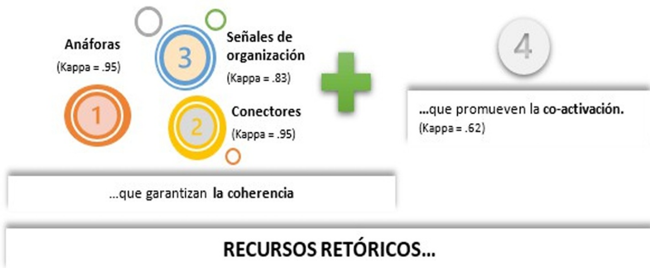
Figura 1 Categorías de análisis.

A modo de ejemplo, se selecciona un texto tipo de 3º (Tabla 2: los fragmentos en color son recursos retóricos que poseía el texto). Para entender su párrafo introductorio es preciso clarificar que hace referencia a una imagen, que acompaña al texto, de una percha ligeramente inclinada hacia el lado izquierdo, del que cuelga un globo hinchado, mientras que, en el lado opuesto, cuelga otro globo sin hinchar. El texto incluye recursos que favorecen la coherencia, en su mayoría, anáforas y conectores (letra verde), señales de organización (letra naranja) y recursos de co-activación (letra morada).